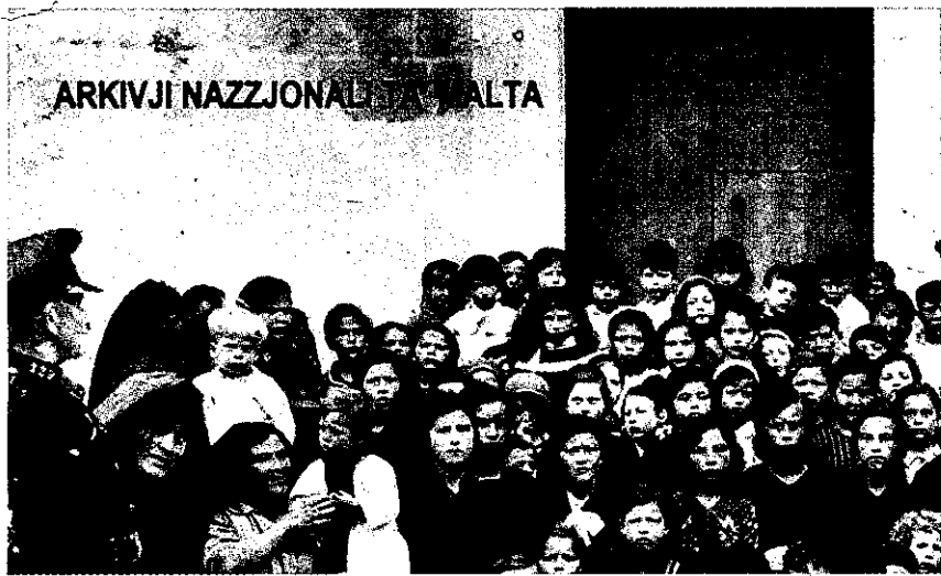
Grupp ta' tfal, li ma kinux jattendu l-iskola, wara festin li kien organizzat għalihom. Ta' min jinnota li whud minnhom għandhom borża helu

ello għall-wiri fil-foyer tal-APS Bank fis-Swatar