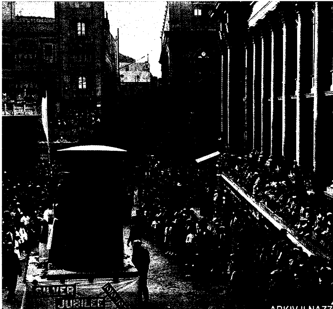
Karru mzejjen waqt il-Battalja tal-Fjuri li nżammet is-Sibt 11 ta' Mejju 1935 mill-5:00pm 'l quddiem. Il-karru jinsab għaddej bejn żewġ binjiet li spiccat fit-Tieni Gwerra Dinija, it-Teatru Rjal u l-istazzjon tal-ferrovija.

Dan il-ktieb qed jingħata b'xejn lil dawk kollha li jżuru din l-esebizzjoni. B'hekk mhux biss qed igawdu minn katalogu jew souvenir li jiġbor fih dawn ir-ritratti, iżda wkoll minn rakkont storiku li jitkellem dwar l-avvenimenti tas-snin tletin tas-seklu għoxrin.