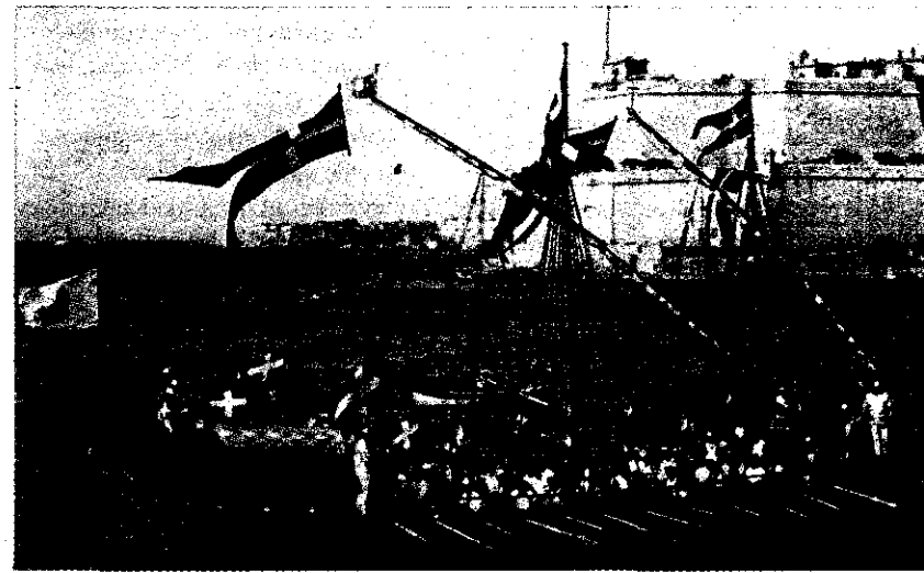
Replika tax-xini San Giovanni, maħdum mill-haddiema tad-Dockyard, waqt il-Karnival fuq l-Ilma li kien organizzat it-Tlieta 7 ta' Mejju 1935

Callus daħal fid-dettall ta' kif intefqu l-flus. L-ikbar ammonti ntefqu fuq il-baned u