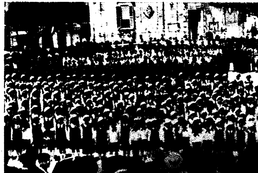
Il-Gvernatur Campbell jindirizza t-tfal tal-iskola u l-iscouts Għawdxin fit-Tokk waqt iż-zjara li għamel f' Għawdex il-Hamis 9 ta' Mejju 1935 bhala parti miċ-ċelebrazzjonijiet tal-Ġublew tar-Re

UFFIĊĊJU TAD-DEPUTAT PRIM MINISTRU MINISTERU GħALL-AFFARIJET EWROPEJ SEGRETARJAT PARLAMENTARI GħALL-PRESIDENZA TAL-UE 2017 U FONDI EWROPEJ