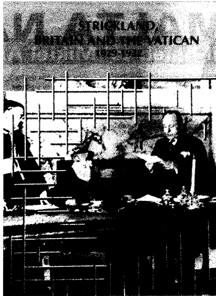
Il-faċċata tal-ktieb 'Strickland, Britain and the Vatican - 1929-1932'