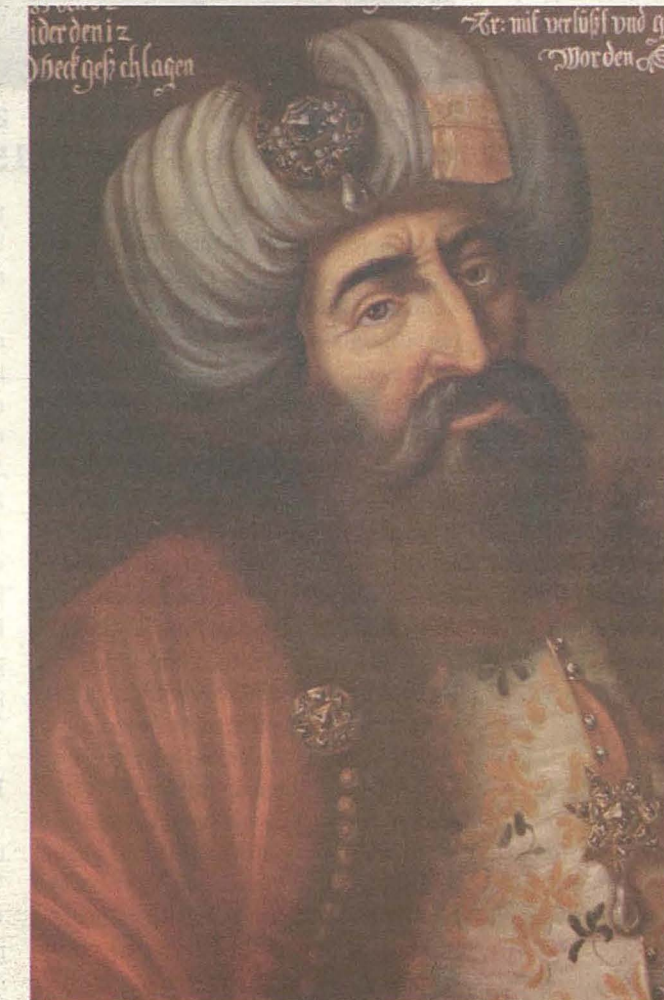
Mustafa Pasha kellu l-kmand tal-forzi Ottomani fuq l-art

de Vallette kellu l-kwalifiki kollha neċessarji ta’ mexxej, kellu personalità, u determinat li ma jhallix lill-Mislem jieħu l-Ewropa f’idejh. Kien proprju b’dawn il-kwalitajiet kollha li rnexxielu jgħaqqad forza Ewropea ta’ Kavallieri, li flimkien ma’ missirijietna ssieltu għal erba’ xhur kontra l-flotta u l-armata ta’ Suleiman u rnexxielhom johorġu rebbieħa. Dwar x’għara fl-Assedju smajna ħafna u mhux l-għan ta’ din il-kitba li tagħti dettalji tal-battalji li għal erba’ xhur shah il-Kavallieri li kienu ferm iżgħar fin-numru mill-għelieda Musulmani, flimkien mal-Maltin, inkluz in-nisa u z-zgħazagh, issieltu b’kuraġġ kbir u determinazzjoni, biex mhux biss salwaw li arthom imma ddeterminaw il-futur tal-Ewropa.