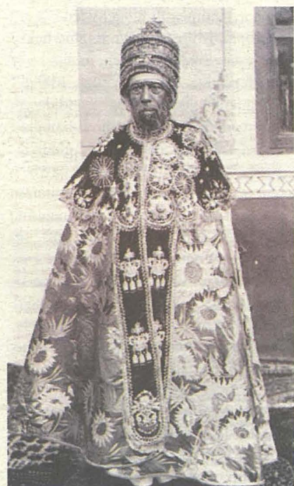
Ir-Re Suleiman II

L -Assedju ta’ Malta tal-1565 ma kienx xi wiehed kumbinazzjoni ta’ piraterija bħalma kien isir dak iż-żmien, imma ppjanat tajjeb ħafna mill-awtoritajiet Ottomani, u li kellu l-iskop ewlieni tiegħu li jekk tintrebaħ Malta jkunu jistgħu jgħawwaw aktar lejn l-Ewropa Ċentrali. Wara ħafna hsieb mis-Sultan Suleiman II li kien wriet il-ħakma mingħand missirju fl-1520, meta kien għad għandu 26 sena biss, f’Ottubru tal-1564 waqt laqgħa li fiha kien hemm l-aktar uffiċjali għolja tal-forzi tal-baħar u tal-art Ottomani, ġie deċiż li l-attakk fuq Malta jsir is-sena ta’ wara. Id-data tal-attakk kellha tkun f’Mejju. Kemm dam jirrenja Suleiman II għamel ħafna suċċess tant li fl-istorja Ewropea nirreferu għalih bħala Suleiman il-Kbir. Fost dawn ir-rebbiet kien hemm dik fuq il-Kavallieri ta’ San Ġwann ġewwa Rodi wara kumbattimenti li damu sitt xhur shah.