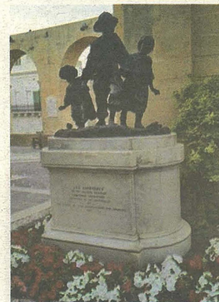
Il-monument Les Gavroches fil-Barrakka ta' Fuq

nghata Giuseppe Garibaldi 'l-eroe dei due mondi' meta żar Malta fl-1864, fejn spikkaw l-atteġġjamenti kuntrastanti bejn l-ammiraturi Maltin tar-Risorgiment a favur ta' Italia unita, u dawk Burboni u papisti li kienu jarawh f'dawl hazin.