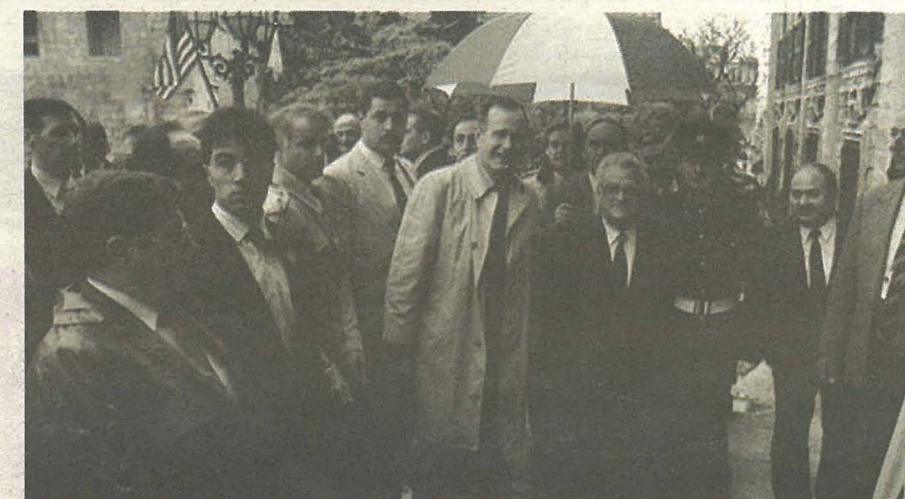
Il-President Emeritus Eddie Fenech Adami meta kien Prim Ministru fl-1989 jagħti merħba lill-President Amerikan George W. Bush li f'Malta ltaqa' mal-President Russu Mikhail Gorbachev