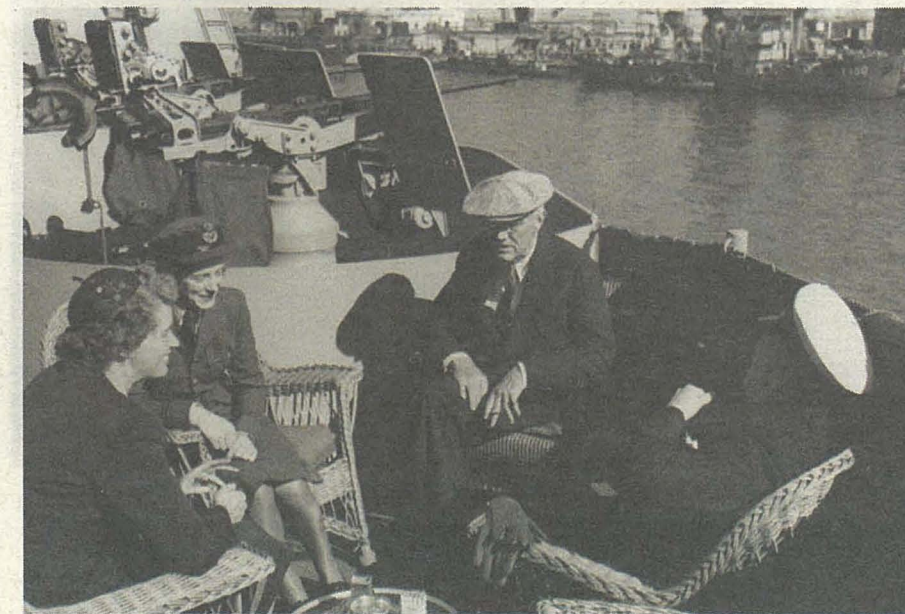
Il-laqgħa bejn il-President Amerikan Franklin Roosevelt u l-Prim Ministru Ingliż Winston Churchill