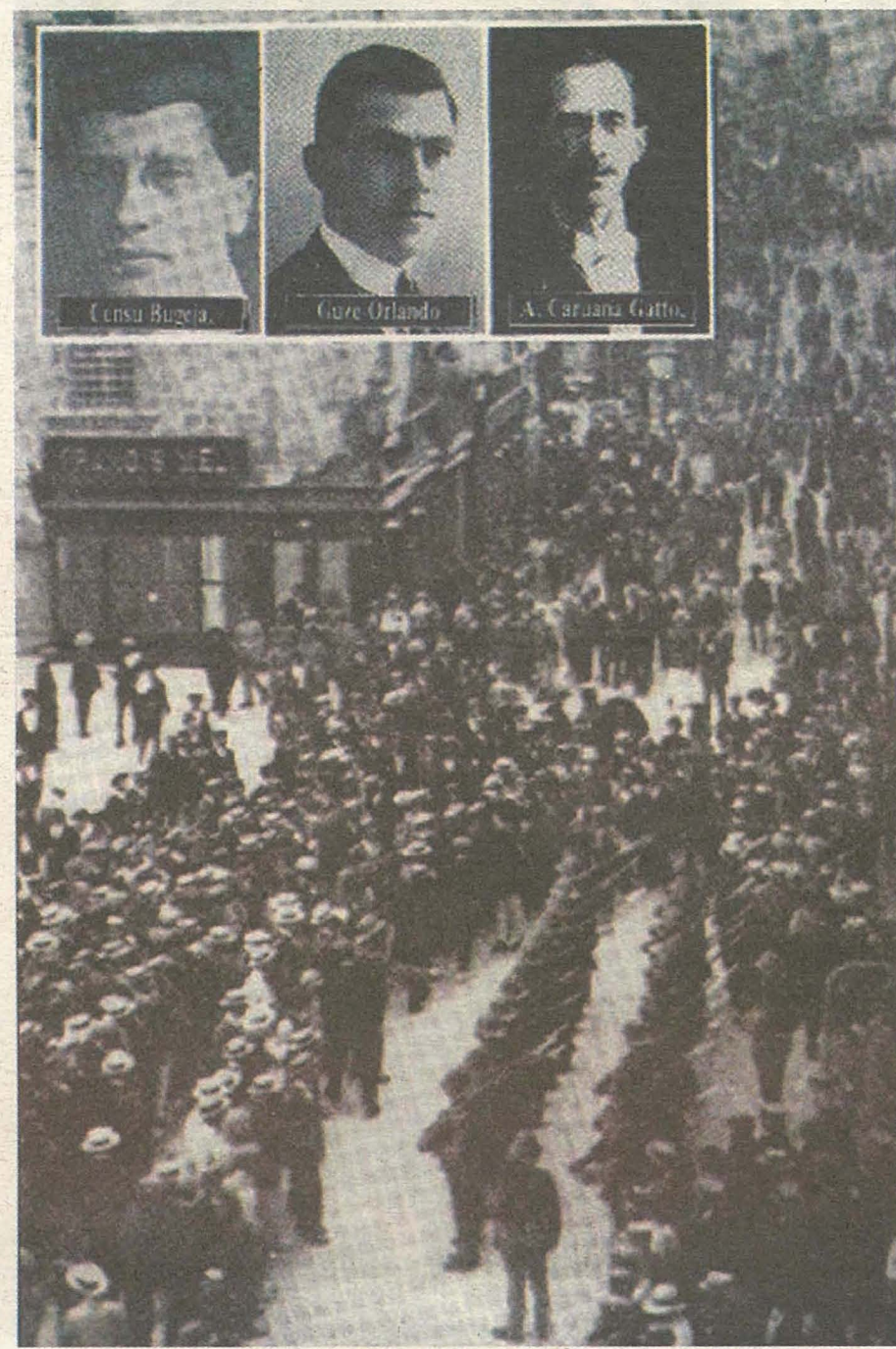
Ir-rewwixxta tas-Sette Giugno