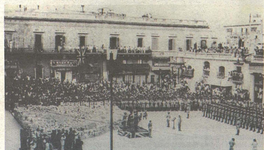
Iċ-ċerimonja tal-ġhoti tal-George Cross