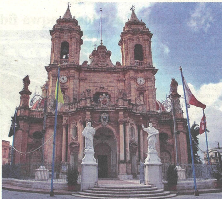
Is-santwarju ta' Haż-Żabbar iddedikat lill-Madonna Omm tal-Grazzja

Din it-talba bil-miktub, flimkien mad-digriet li bih Dun Angelo Pontremoli inhatar bhala l-ewwel kappillan, jinsab fl-Arkivju tal-Kurja. F'din it-talba (supplika) insibu mnizzel it-tbatija li n-nies kellhom biex jirċievu s-sagramenti, speċjalment dak tal-Morda. Huma xtaqu wkoll li l-Isqof jahtar lil Dun Angelo Pontremoli bhala l-ewwel kappillan. Insibu wkoll li talbu biex il-knisja fil-jali tal-Madonna tal-Grazzja issir knisja