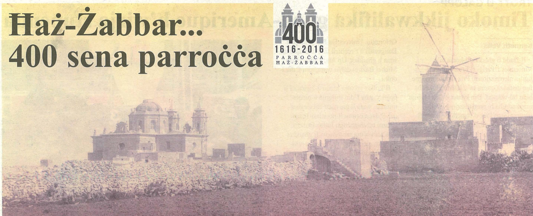
Dehra mill-boghod tas-Santwarju ta' Haż-Żabbar bil-koppla l-antika, u fil-ġenb fuq il-lemin il-logo tal-festi ċentinarji