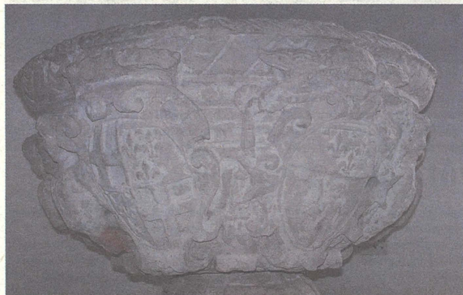
Il-fonti tal-magħmudija li juru l-arma tal-Isqof Cagliares, li għamel Haż-Żabbar parroċċa, u tal-Granmastru Wignacourt li kien Granmastru dak iż-żmien

Fil-Milied tas-sena 1615, l-Isqof Cagliares laqa' t-talba bil-miktub li ressqu ż-Żabbarin u għarraf biha lill-kappillan taż-Żejtun, Dun Matteo Burlò, bil-hsieb tiegħu li jagħmel Haż-Żabbar parroċċa għalih. Il-kappillan Żejtuni ma sabx oġġezzjoni u b'hekk inbeda l-proċess li wassal biex fl-10 ta' Jannar 1616, l-Isqof Baldassare Cagliares ta d-digriet li bih hatar lil Dun Angelo Pontremoli bhala l-ewwel kappillan tal-parroċċa ta' Haż-Żabbar, bit-territorju tagħha jittiehed minn dak taż-Żejtun.