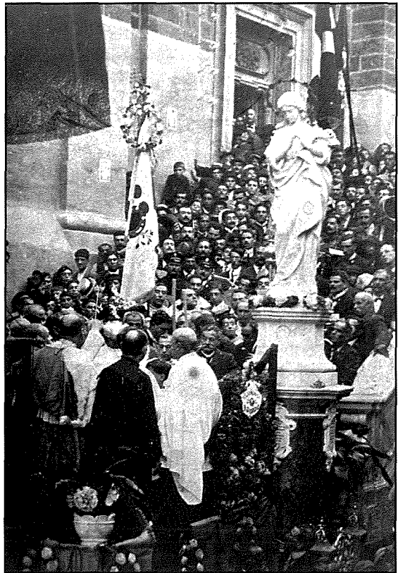
L-Inawgurazzjoni ta' l-Istatwa taz-zuntier fl-1919.

L-inawgurazzjoni u t-berik ta' din l-istatwa grazzjuża kienu saru bil-kbir, nhar l-Ewwel Hadd ta' l-Avvent li habat it-30 ta' Novembru, 1919, kif jidher minn ritratti antiki li għadhom jeżistu. Fuq it-taraġ taz-zuntier quddiem l-istatwa ntrama palk imżejjen bid-damask, kuruni u girlandi tal-fjuri, li