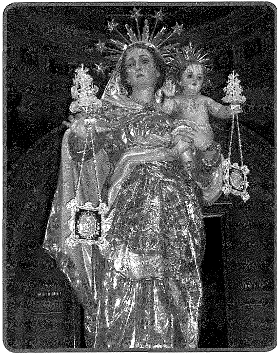
L-istatwa tal-Madonna tal-Karmnu fiż-Żurrieq