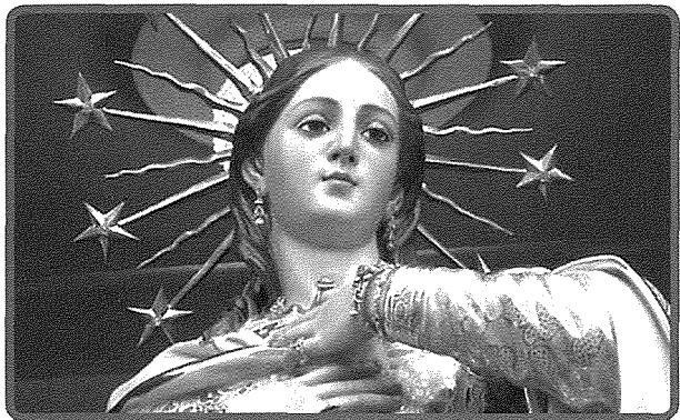
L-istatwa tal-Kuncizzjoni tal-Patrijiet Minuri fil-Belt Victoria, Ghawdex.