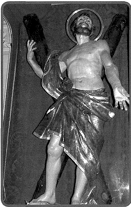
L-istatwa ta' San'Andrija