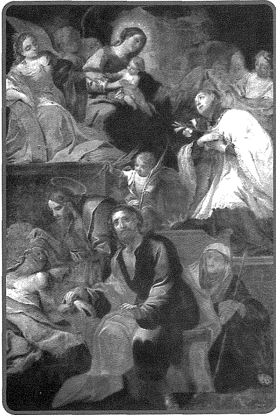
Pittura tal-Altar ta' Santa Katarina