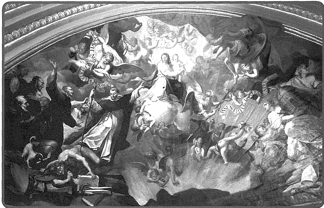
Pittura fil-Knisja Arcipretali taż-Żejtun.