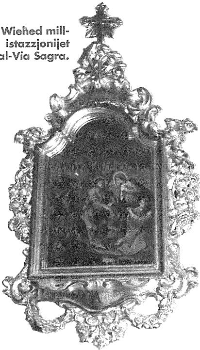
Wiehed mill-istazzjonijiet tal-Via Sagra.