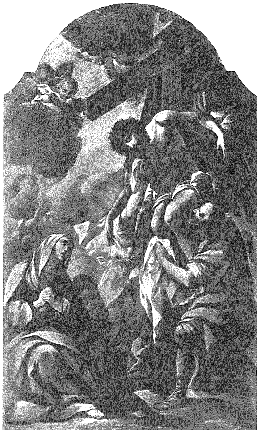
It- Titular tal-artal tal-oratorji