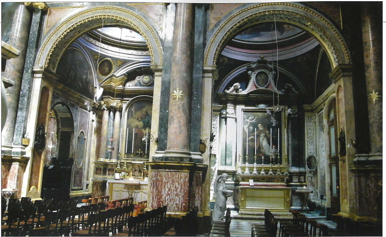
Il-kolonna fil-Korsija fil-Kollegġjata ta' San Pawl