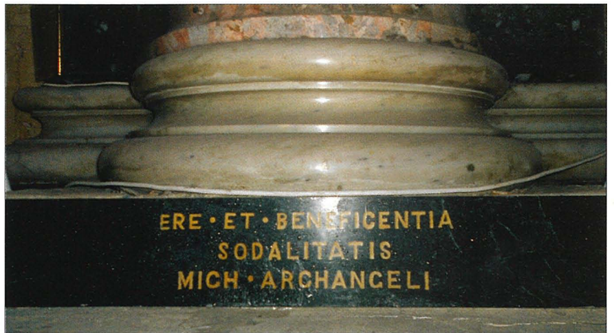
Dettall tal-ismijiet tal-benefatturi fuq il-bażi taht il-kolonna