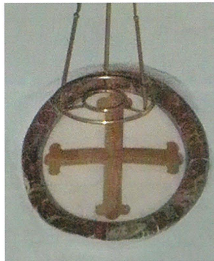
Wieħed mis-slaleb tal-konsagrazzjoni l-antiki li jinsab fuq il-kolonna tal-Knisja ta' San Frangisk fil-Belt Valletta