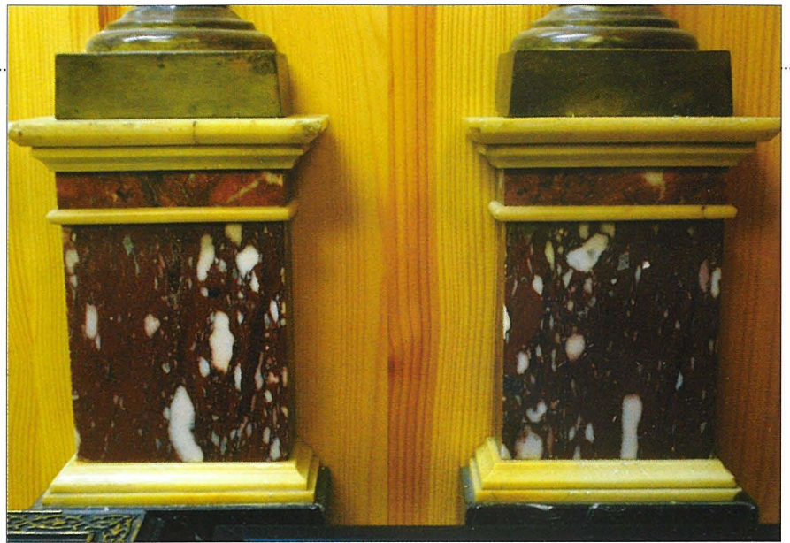
Il-mudelli tal-pedestalli tal-kolonna. Kollezzjoni Domus Pauli.

Sfida akbar f'dan il-proġett kienet li l-qisien tal-ġebel għall-irham jibqgħu l-istess. Dan għall-fatt li d-damask fin tal-festa li kien sar xi snin qabel kien sewa hafna flus u għalhekk kellu jitlibbes għall-festa fuq l-irham bħal ma kien isir fuq il-korsija tal-ġebel. Dan jikkonfermah il-fatt li l-istil tal-korsija ma nbidilx,