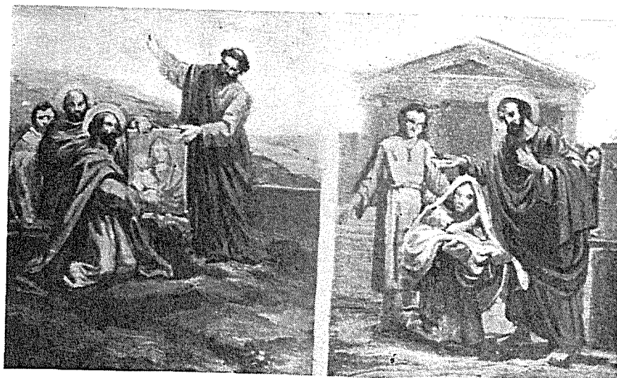
Eżempji ta' pittura ta' Rafel Bonnici Cali