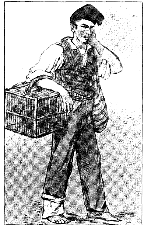
Xi bejgiegħa kienu jigu bil-mixi

Mill-pjazza s-Sonu kien jilhaq ibiegħ kollox, u ma jibqagħlu xejn x'jagħmel ħlief li jdabbar rasu, mat-twajba hmara tiegħu, lejn id-dar.