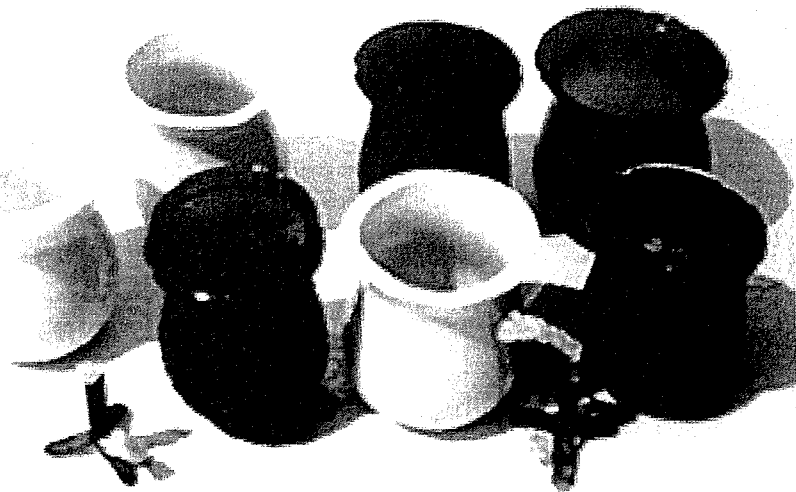
Tazzi taz-žejt u żewġ ċimblori bil-ftila

Dawn kienu jkunu ta' xi għaxar centimetri għoli. L-ilwien kienu minn kullma tista' timmagina. Kien hemm tazzi trasparenti u oħrajn opaki u kienu jkunu għal kollox lixxi jew b'xi disinn imqabbez. It-tazzi kienu fil-maġġoranza tagħhom kollha bil-qiegħ catt, b'hekk jistgħu jieqfu fuq wiċċ livell, imma kien hawn oħrajn, l-aktar dawk destinati biex jiddendlu f'għamla ta' linef, li kellhom il-qiegħ fit-tond. It-tazzi kien hemm bżonn li jorbtuom tajjeb