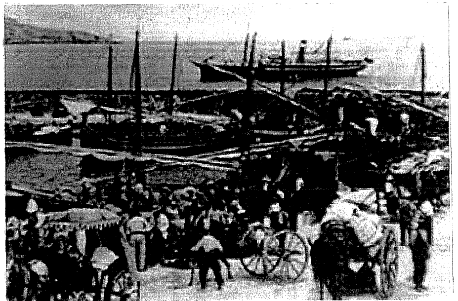
Ix-Xatt: Il-port tal-Imġarr, Għawdex, għall-habta tal-1900

Placenames of the Maltese Islands ca 1300-1800