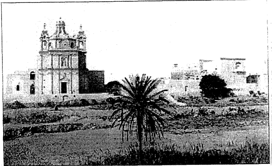
Il-knisja ta' Sant'Antnin ta' Padova -