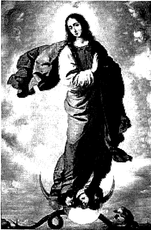
L-ikonografija tal-Kunċizzjoni kif żviluppat maż-żmien – bil-qamar u s-serpent taht saqajha