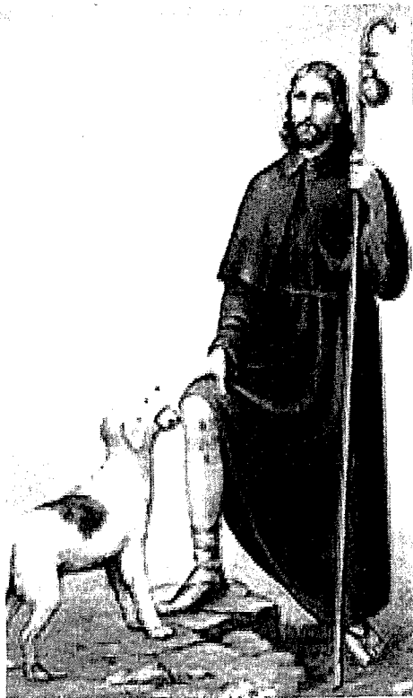
L-ikonografija ta' Santu Rokku, bil-ġerha f'koxxtu, u kelb joffriju l-hobż.

Il-bidla tal-istatwi proċessjonali f'Haż-Zabbar, l-Imqabba u s-Siggiewi għandhom jiġu studjati fil-iżvilupp ta' din il-modi. Meta n-nies tas-Siggiewi ddecidew li jibnu knisja parrokkjali ġdida, huma ħadu fil-bini l-ġdid ħafna mill-operi li kien hemm fil-knisja l-qadima - inkluzi l-istatwa antika ta' San Nikola. Cocco Palmieri jirregistra l-eżistenza ta' din l-istatwa antika fil-knisja l-ġdida, fejn komplet tintuza fil-festi ad unur dan