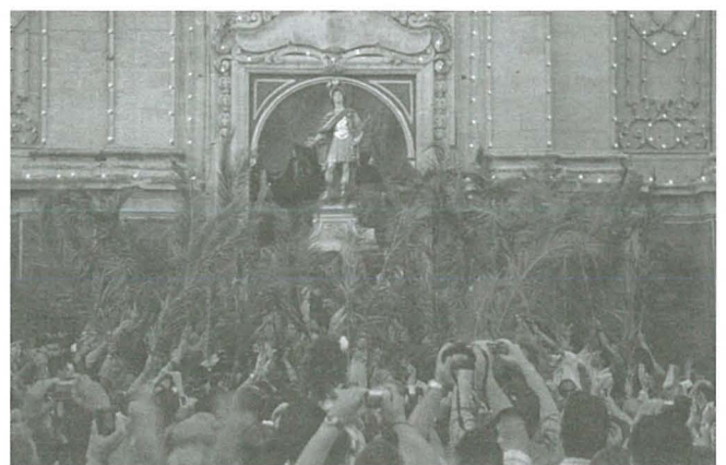
San Ġorġ ħiereg għall-purċissjoni

L-ewwel baned Għawdxin kienu mwaqqfa legalment bħala La Stella Vincitrice u Il Leone b'atti notarili tal-11 ta' Jannar u tas-6 ta' Frar 1881 rispettivament 2 ; madankollu huma kienu diġà eżistenti għal diversi snin qabel dawn id-dati. Fiż-żmien meta l-Kastell ta' Għawdex kellu biss daħla waħda u ċkejna, ma kienx possibbli li mill-Katidral joħorġu purċissjonijiet bi statwi mdaqqsqa. Mhux biss, imma matul is-snin tal-unjoni (1688-1955), il-Knisja Matriċi ma kellhiex baned mużikali affiljati magħha. Iż-żewġ baned tar-Rabat kienu allura jakkumpanjaw purċissjonijiet li joħorġu minn San Ġorġ. Sal-1956 – is-sena li fiha l-Banda Leone rregalat l-istatwa artistika ta' Santa Marija lill-Knisja Katidrali – il-purċissjoni ta' Santa Marija mmexxija minn xi membru tal-Kapitlu Katidrali, kienet tinzel mill-Katidral mingħajr statwa u tidhol San