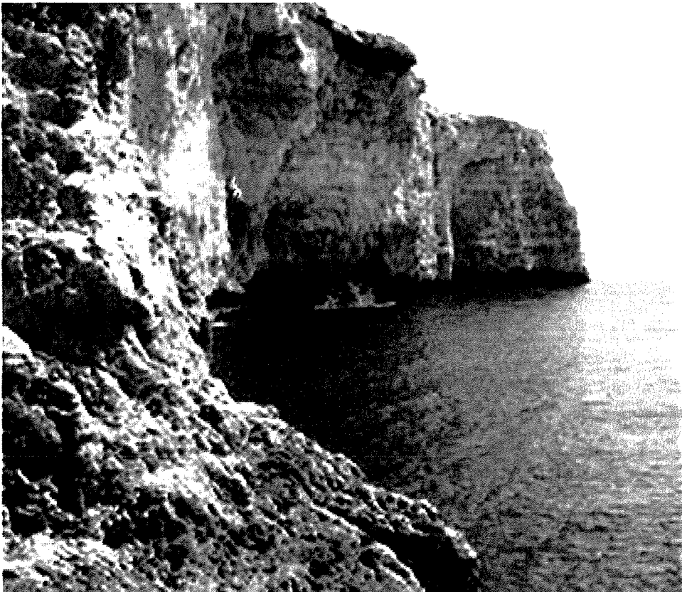
Sisien jaqtgħu dritt ċomb għall-baħar

Migra l-Ferha hija marbuta ma' legġenda popolari li tghid li meta l-Konti Ruggieru u n-Normanni ħatfu lil Malta fl-1091, zbarkaw propju hawn billi dan il-post mistur kien qrib l-Imdina u fl-istess waqt ma kienx mgħasses. Izda jidher li din hija biss qlajja' msejsa fuq il-fehma zbaljata li l-isem tal-post ifisser "għajja ta' ferħ", u aktarx li l-isem ifisser biss migra żgħira tal-ilma (f'dan il-każ, 'ferħa' hija s-singular ta' 'frieħ'). Il-Professor Wettinger jagħti wkoll interpretazzjoni oħra billi jigħidliha l-attenzjoni li fid-dinja Għarbija 'Ferħa' huwa wkoll isem pjuttost komuni fost in-nisa. Ngħiduha kif inhi, biex tnizzel armata sħiħa f'post bħal dan mhux biss trid kedda liema bħalha izda wkoll trid tkun ixxurtjat u tinzerta baħar bnazzi zejt. Madankollu, G.F. Abela jgħidliha li fi zmienu hawn kien hawn ħajt għoli biex ifixkel l-inzul tal-furbani, għalkemm għandi dubji dwar kemm huwa minnu dan id-dettall. L-uniku episodju storiku dokumentat marbut ma' din il-parti tax-xtut Maltin seħħ fit-Tieni Gwerra Dinjija u xejn ma ntemm b'wiċċ il-ġid għall-patrijott Malti Carmelo Borg Pisani. Billi kien jemmen li Malta kellha tinfeda mill-ħakma kolonjali Ingliza sabiex issib postha bħala parti mill-Italja, fl-1942 daħal voluntier għal missjoni ta' spjunagġ tar-Regia Marina Taljana li kellha twitti t-triq għal invazjoni. Biex ma jintlemahx mill-għases, nizzluh fil-