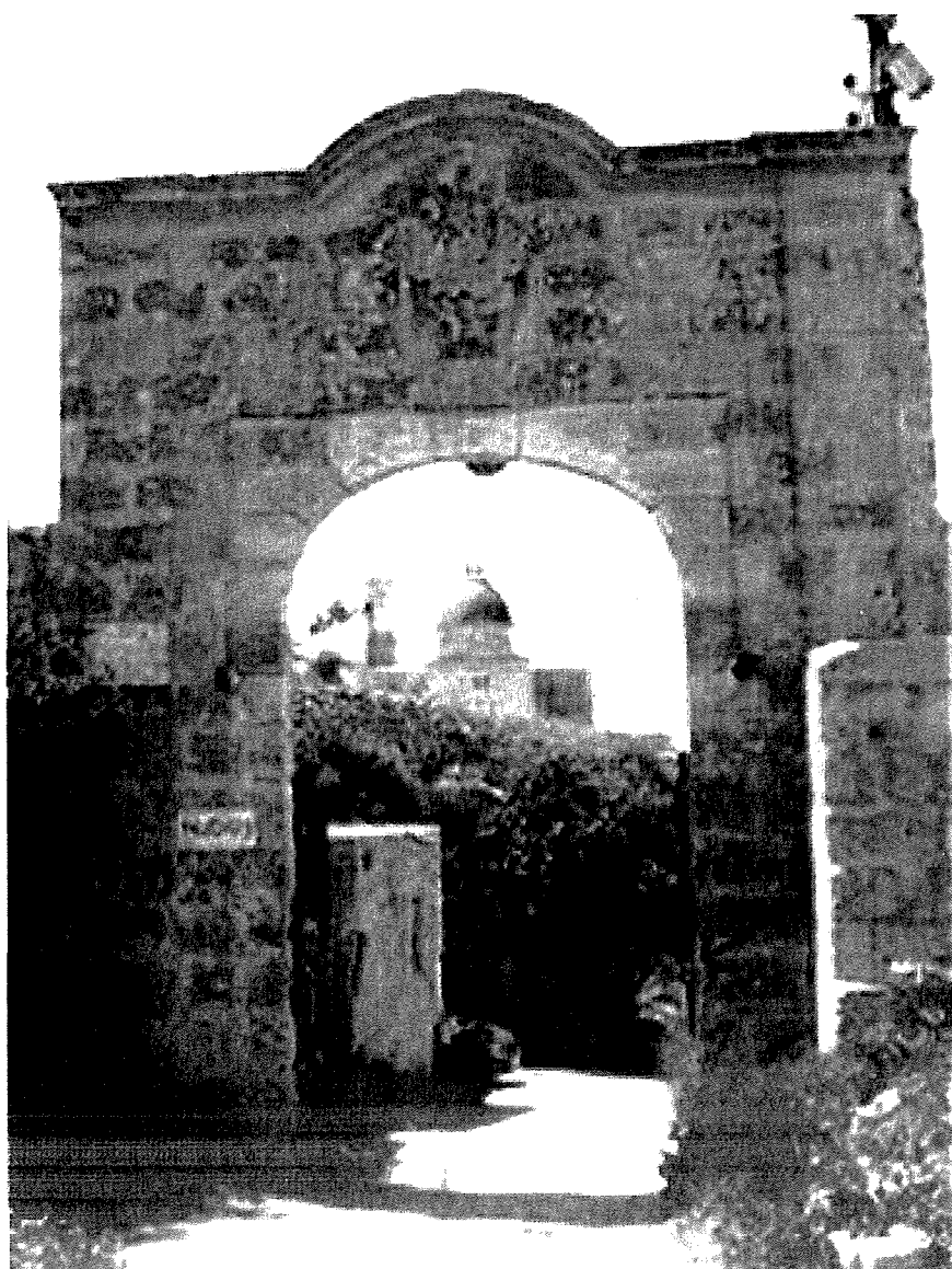
Rixtellu b'arkata Monumentali

f'tiegħu) sar parti minn sistema estensiva u b'tifsila stramba, u fl-istess waqt Wied ir-Rummien sar il-bidu ta' dak li kien għad fadal mill-wied l-ieħor. Il-proċess kien megħjun ukoll minn wied ieħor żgħir (fergħa sekondarja ta' Wied ir-Rum) li jinzel eżatt bi dritt it-tnaqqira li semmejt; dan il-wied għadu jidher sal-lum u minn ġo fih tinzel it-trejqa li twassal mill-Imtaħleb lejn Għar id-Dwieb, izda s'issa ma rnexxilix nitkixxef x'ighidulu.