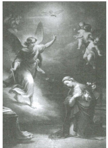
It-titular tal-knisja parrokkjali ta' Ħal Tarxien, xogħol il-pittur Pietro Gagliardi

Rużarju ordnat il-lampier speċjali li jiddendel quddiem l-artal il-maġġur għan-novena tal-Milied. Dan fih disa' tazez żgħar u waħda kbira fin-nofs. It-tazez iż-żgħar jirrapprezentaw id-disat ijiem tan-novena. Dan il-lampier hu magħruf bħala l-Brimba. Fil-knisja arċimatriċi ta' San Ġorġ f'Ħal Qormi hemm lampier ta' dan it-tip. Barra minn hekk, il-knisja parrokkjali ta' Ħal Tarxien kellha mwaqqfa Sodalità ta' Ġesù Tarbija – Pia Fondazione Ġesù Bambino. Din twaqqfet b'digriet tal-Isqof Alpheran de Bussan li jgħib id-data ta' Settembru 1748. Sena wara l-istess isqof approva l-istatut tagħha. Din is-sodalità twaqqfet fuq l-artal ta' San Ġużepp fejn kien hemm niċċa tal-injam indurata u fiha kien hemm xbieha ta' Ġesù Tarbija tax-xema'. L-istudju tal-istorja Tarxiniża Joseph A. Farrugia jgħid: 'Wieħed għandu jifhem li dik ix-xbieha tal-Bambin tat bidu għal din is-sodalità. Din is-sodalità kienet torganizza quddies kantata li kienet tinkludi wkoll il-vespri