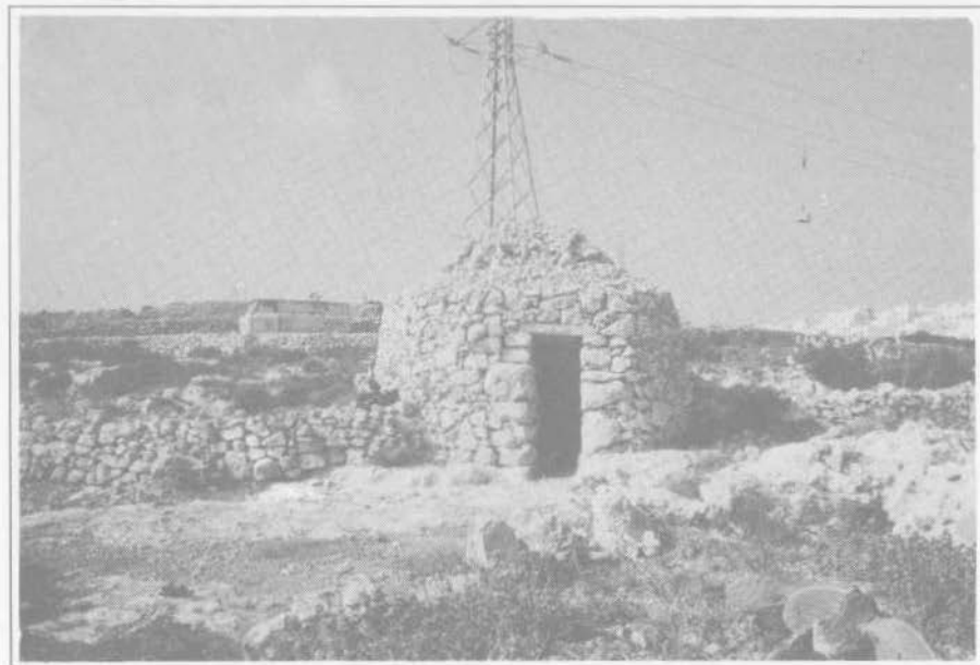
4. Capanna contadina in muratura a secco con accesso alto e stretto.