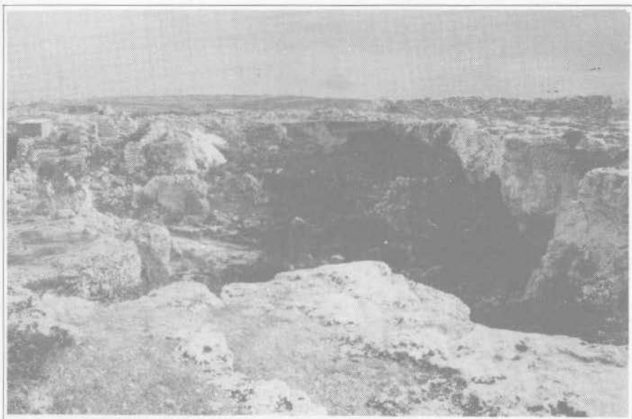
1. Ghar il-Kbir (Dingli). Insediamento rupestre in dolina di sfondamento tettonico.