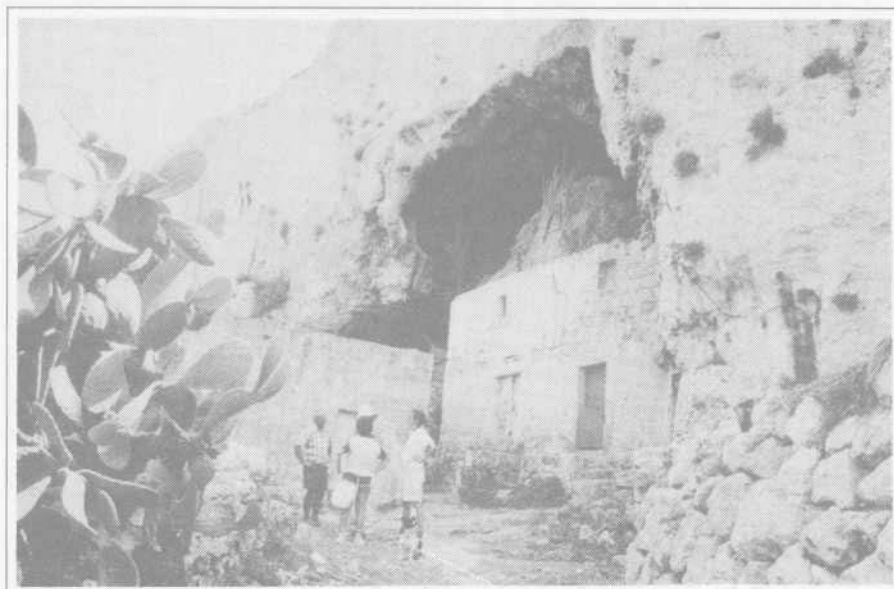
6. Ghar San Niklaw. Edificio autonomo inserito in cavità naturale ristrutturata.