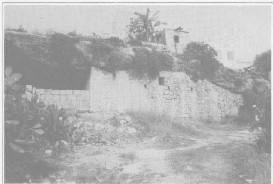
3. Manikata. Insediamento rupestre in riparo sotto roccia con massiccio utilizzo della muratura a secco.