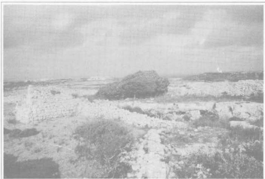
2. Ghar il-Kbir. Dolina secondaria con associazione dell'abitato rupestre con l'edilizia in muratura.