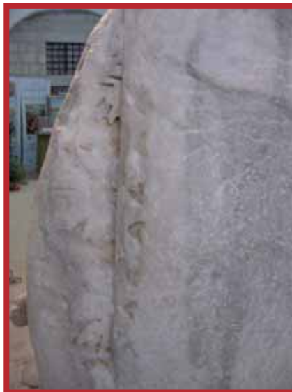
Dettall: Disinn fid-dahar ta' l-istatwa – fregġu bil-weraq ta' l-akantu