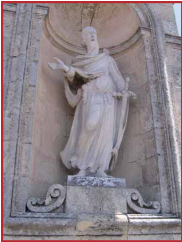
L-istatwa qabel ma tnizzlet min-niċċa

kollha mtajra kienet f'dawn l-ahhar hmistax-il sena msewwija. Is-swaba kienu ġew maħduma b'xi cement abjad iebes li għatta hafna mill-original. Apparti minn dawn, l-istatwa soffriet minn daqqiet permezz ta' hbit minn oġġetti oħra. Sinjali ta' dan jidhru f'diversi forom bħal grif fond u partijiet mtajra bħal fix-xfar tal-lisba.