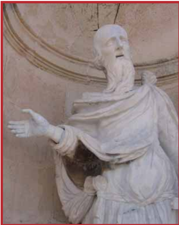
L-id il-lemnija ta' l-istatwa – mhux mill-istess irhama

ghalhekk li l-id ix-xellugija hariġha minn biċċa rhama separata u mhux mill-istess blokka.