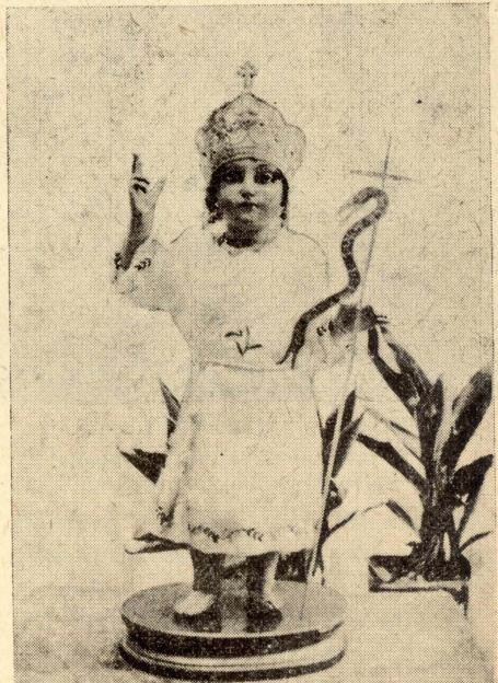
L-istatwa ta' San Ġwann ċkejken. (Ritratt meħud mill-kittieb, fil-bitha tas-Sagristija).

Il-Misilmin jemmnu hafna b'San Ġwann il-Għammiedi, u jgħidu li hu profeta tagħhom, u jsemmuh in-Nebi Jahji, jgħifieri: il- profeta li jagħti l-hajja. Għal hekk, qabel ma sar il-ġlied bejn il-Għarab u l-Lhud, dal-aħhar, meta f'dar-rahal kienu jgħammru xi tliet e'ef Misilmin (u biex ngħiduha wkoll, xi tliet mija Insara, li issa harbu kollha, u minnhom ma baqa' hadd), fil-24 ta' Ġunju, meta s-sura ta' San Ġwann żgħir kienet tittieħed mis-sagrestija u titqiegħed fuq l-artal, haf-