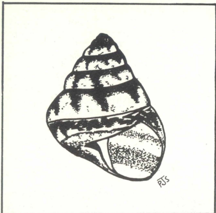
Cochicella conoidea li tinstab fuq il-munzelli tar-ramel fl-Ghadira.