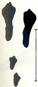
Passi ta' Fenek

kollha jgħinu biex din in-niċċa żgħira fl-ambjent naturali Malti tispicċa darba għal dejjem. F'dawn il-munzelli tar-ramel jinsabu varjeta' ta' annimali u pjanti li mhux biss huma interessanti imma whud minnhom jinstabu f'pajjiżna biss u imkien aktar. Hemm bżonn għalhekk li dawn il-postijiet mhux biss jiġu mħarsa mil-liġi imma mħarsa ukoll mill-vandaliżmu tal-poplu billi ngħinnuh japprezza u jħares dawn il-munzelli tar-ramel bħala parti mill-wirt naturali ta' pajjiżna.