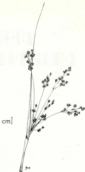
SIMAR - Juncus maritimus Il-parti ta' fuq taz-zokk tal-fjuri. Pjanta minn Marsaxlokk

L-għadira mielħa hija ambjent li fil-Gzejjer taġġna qiegħed jinqered. L-akbar waħda u l-aktar importanti, dik tal-Marsa, ġa ġiet megruda bosta snin ilu (mill-1861 'il quddiem) u ħafna f'hejje li kienu magħrufa li jinstabu hemm issa spicċaw.