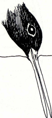
Ċuvett Spotted Red Shank