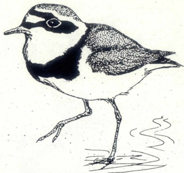
Monakella saqajha suwed

żmien qasir ta' tliet ġimgħat, meta f'daqqa waħda fteġ r-Rebbieġha. Huwa jbid qalb il-faxix fil-bwar viċin il-kosta jew fix-xtut tax-xmajjar fejn dawn jin-ġhaqdu mal-baħar, għalkemm xi mindaqiet ibejjet ukoll aktar 'il fuq fit-Tundra 'l-bogħod mill-baħar. Mill-banda l-oħra meta jpassi jieħu vantaġġ minn aġħdajjar kbar u zgħar, xi mindaqiet ukoll il-bogħod mill-baħar. Imbagħad f'postijiet fejn iqatta' x-xitwa bħall-Indja u l-Afrika t'Isfel, iġħix fil-bwar jew mal-baħar f'temperaturi ferm aktar għoljin. mill-Artiku.