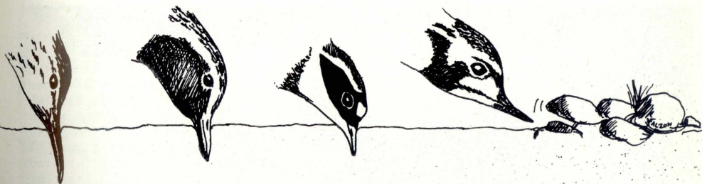
Beggazzina tat-tizz Dunlin