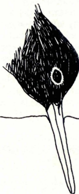
Gallina tal-baħar Oyster catcher