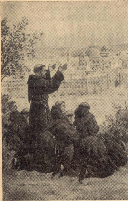
SAN FRANĠISK T'ASSISI, mar-Rhieb tiegħu, jara l-ewwel darba lil Ġerusalem.

Ġieb miegħu mill-Art tal-Fidwa ż-żewġ imhabbiet kbar li jfakkru l-bidu u l-milja tal-Helsien tagħna.