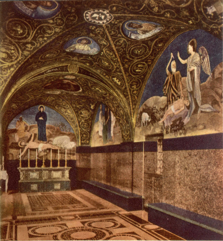
ĠERUSALEM: KAPPELLA TA' FUQ IL-KALVARJU