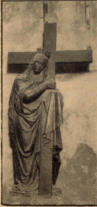
Ġerusalem. — Statwa tal-bronż ta' Santa Liena, fuq l-artal, fil-ġiebjta tas-Salib.

na snin Ġerusalem). U meta Jusef niżżel lil Ġesù mis-salib, ftit kien baqa' biex tghib ix-xemx, u dik inhar kien