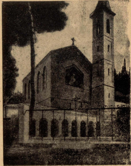
PALESTINA. — Il-knisja l-oħra ta' Ghajn Karem, fejn il-Madonna marret iż-żur lil Santa Liżabetta, fejn tispicċa t-triq ta' l-Insara.