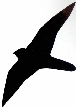
Tajr tal-priża tal-ġwienah dojoq

Jekk inharsu lejn it-tajr tal-priża mill-mod kif itir, nistghu naqsmuh f'żewġ gruppi: dak li jiġbor fih dawk l-ispeċi li għandhom ġwienah dojoq, bħal nġhidu aħna l-bghadan* u l-isqra, u dawk li għandhom ġwenhahjom wesghin, bħal nġhidu aħna l-ajkli u l-avultuni. Dawk ta' ġwenhahjom dojoq jaqdfu sewwa bil-ġwienah u ma jiddependux mill-kurrenti ta' l-arja shuna tielgħa mill-art ( thermals ). Mill-banda l-oħra, dawk tal-ġwienah wesghin jiddependu hafna mill-kurrenti ta' l-arja shuna telgħin mill-art, biex mingħajr ma jaqdfu bil-ġwienah, iżommu fl-arja għal hinijiet twal.