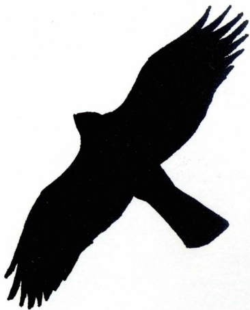
Tajr tal-priża tal-ġwienah wesghin