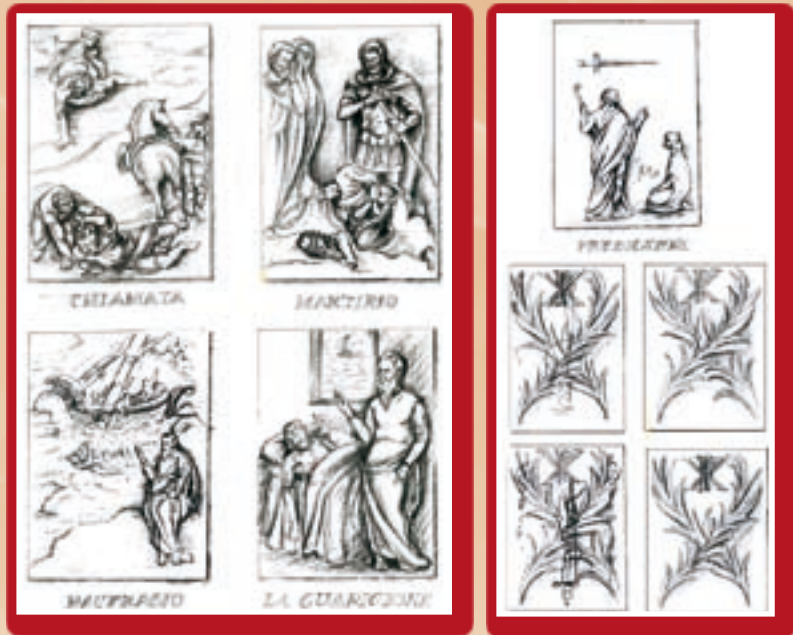
Id-disinji oriġinali tar-rilievi

3. Majjirizultax jekk id-disinji li ġew preżentati kinux invenzjoni oriġinali jew inkella kinux ispirati minn kwadri li jinsabu barra minn pajjiżna. Izda meta ġew preżentati, saru konsiderazzjonijiet godda. L-ewwelnett ġie deċiż li wiehed mis-suġġetti