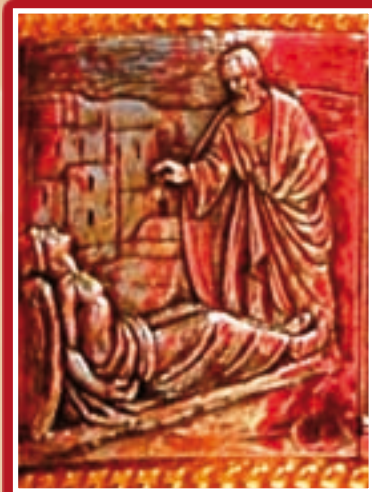
Il-Fejtan: pittura, disinn, riliev

darba haj u attiv u darba qed isofri l-martirju u f'xi każ anki darb'ohra fil-glorja. Din is-serje kienet proprjetà tal-kollegjali tal-Grotta u kienet ingabet mill- Conservatoria tal-Ordni ta' San Ġwann biex iżżejjen is-sagristija l-ġdida tal-Knisja ta' San Publiju li nbriet fl-ewwel snin tal-1680. Fil-fatt dawn il-kwadri baqghu f'din is-sagristija għal aktar minn tlett mitt sena, u ġew trasferiti fis-sagristija ż-żghira ta' San Pawl mill-Arċipriet Louis Suban ftit snin ilu biex jitgawdew aktar.