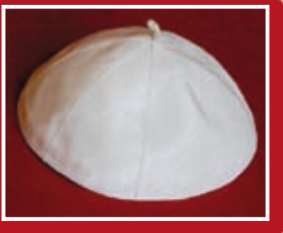
Benedittu XVI; Pultruna, kaxxa, kallotta u awtografu