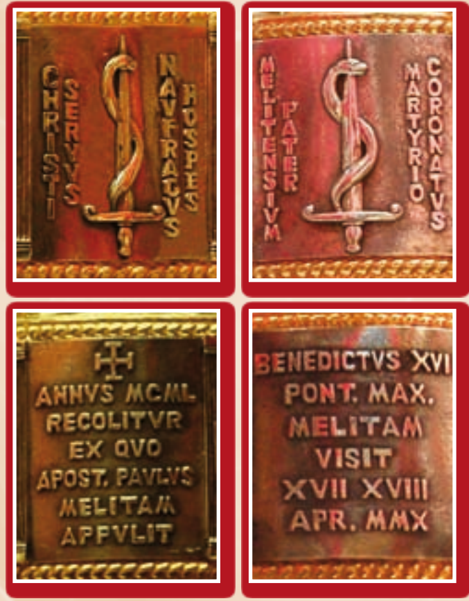
Id-disinji tal-iskrizzjonijiet: l-oriġinali u l-finali