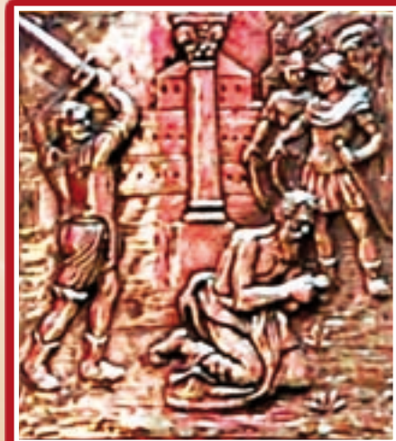
Il-Martirju: Pittura, disinn, riliev