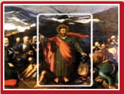
In-Nawfragju: pittura, disinn, riliev

4. Il-Martirju ta' San Pawl 5 . Il-kwadru li ġie magħżul għandu storja kurjuża li tajjeb tinkiteb. Huwa wiehed minn serje ta' tmax-il kwadru orizzontali li juru l-martirju tat-tmax l-appostlu iżda f'dawn il-kwadri kull appostlu hu muri darbtejn,