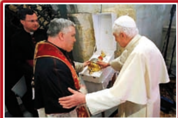
Il-Papa Benedittu jipprezenta l-lampier lill-Arċipriet fil-Grotta

Fil-ktieb tal-Festa tas-sena l-oħra diġà nkiteb xi haġa dwar dan ir-rigal li nhadem f'Ruma mid-ditta Savi 1 . Hawnehk se naghti aktar dettalji wara li d-Ditta Savi fuq talba tiegħi baġhtilna kopja tad-disinji kollha li saru mill-istess Ditta biex isir dan il-lampier. Irrid inżid li qabel ma tlabt dawn id-