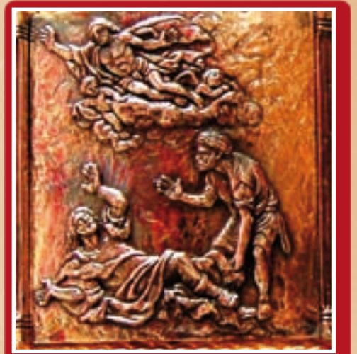
Il-Konversjoni: pittura, disinn, riliev

ta' kwadri li jinsabu f'Malta u li fis-sena Pawlina rawhom hafna Maltin u barranin, fosthom il-Kardinal Ennio Antonelli, il-mibghut speċjali tal-Papa għal Malta għas-sena Pawlina. B'hekk ma kienx hemm għalfejn jittiehdu ritratti godda. Ir-ritratti illustrati fil-ktieb tal-wirja intagħzlu għax huma l-aħrajn fuq is-suġġett tagħhom, anki jekk f'Malta hemm kwadri ohrajn fuq l-istess suġġett. Naturalment minn dawn il-kwadri riedu jintagħzlu biss dettalji ċentrali, għax ir-riljievi tal-lampier huma biss ta' ftit ċentimetri.