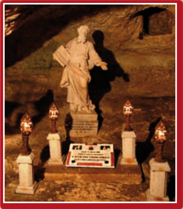
Pawlu VI: lampadari

Fl-ahharnett il- Papa Benedittu XVI mhux biss żar il-Grotta, l-uniku santwarju li żar fil-mawra qasira tiegħu f'Malta, iżda pprezentalna personalment irrigal wisq sabih tal-lampier li ddeskrivejna f'dan l-artiklu. Iffirma wkoll il-ktieb li tal-Viżitaturi. Hu