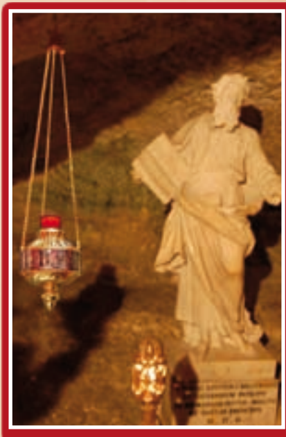
Id-disinn shih tal-lampier u l-lampier li gie esegwit

“Imma hu farfar il-lifgħa ġon-nar u ma ġralu xejn”