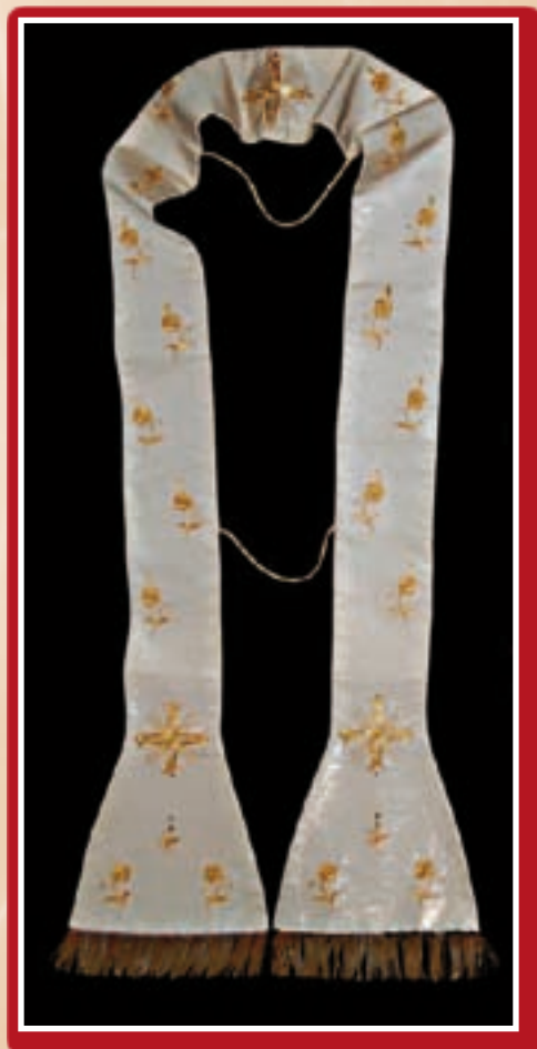
Ġwanni XXIII: Stola

ttamat li d-diskors fejn semma l-Grotta jiġi fil-futur imfakkar f'irhama mal-hajt laterali tal-Knisja ta' San Publiju, viċin l-irhama l-oħra li tirreġistra d-diskors fuq il-Grotta tal-Papa Ġwanni Pawlu II.