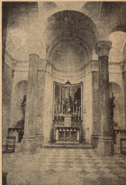
ĠERUSALEM. — Il-knisja tal-Kundanna mibnija mill-Frangiskani fil-Pretorju ta' Pilatu.

għa hemm knisja oħra, mudlama wkoll, f'idejn il-Griegi Kattolki fejn il-