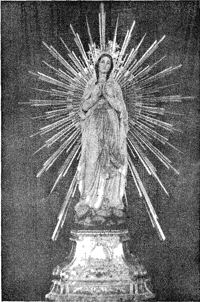
IL-VARA TAL-B.V.M. TA' LOURDES