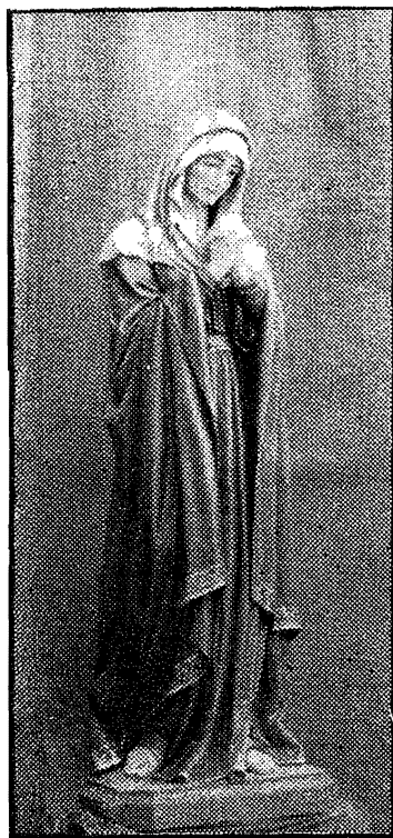
Il-Vara tal-Madonna tad-Duluri