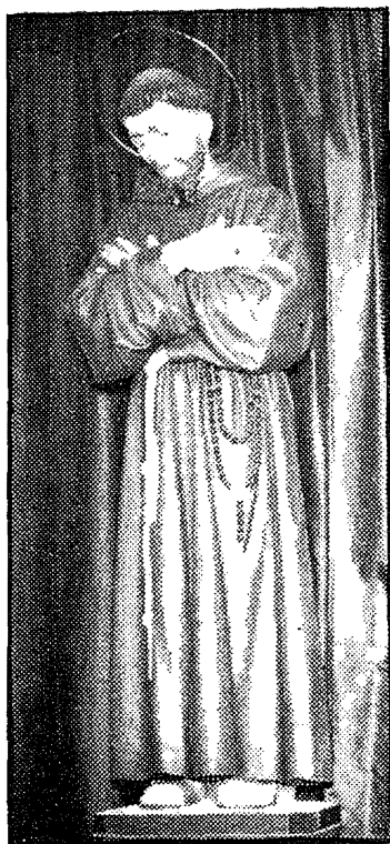
Il-Vara ta' San Frangisk t'Assisi