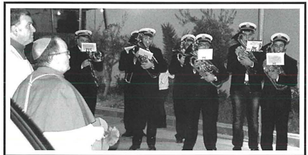
(Dawn ir-ritratti ġew meħuda nhar l-1 ta' Frar 2015.)