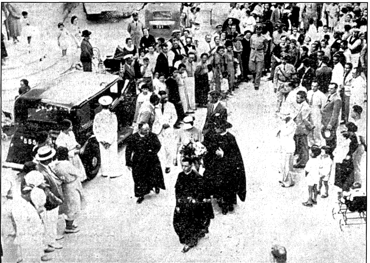
Il-wasla tal-Gvernatur hdejn il-knisja. Jidher ukoll il-Kappillan Zahra.

Wara l-Gvernatur mexxa sad-dar tal-kappillan qalb il-folla li ngabret maż-żewġ nahat tat-triq. Hawn ta' min isemmi kumment li ghamel reporter ta' ġurnal li kien johroġ dak iż-żmien. Hu nnota li t-tfal li hargu ma' ommijethom fil-bieb ta' barra biex jassistu ghal din il-ġrajja kienu lebsin tajjeb, b'wiċċhom maħsul sewwa u