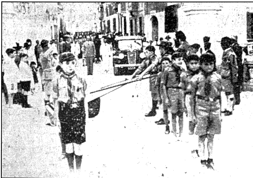
L-Iscoots fuq iż-zuntier tal-knisja jilqghu lill-Gvernatur

Bil-hatra tieghu f'Marzu ta' l-istess sena, wara l-mewt tal-Gvernatur Sir David Campbell, Bonham Carter beda sensiela ta' żjajjar fl-irhula Maltin u Ghawdxin. B'kollox żar sittin parroċċa, li l-ebda Gvernatur jew Kummissarju Ċivili ma kien għamel sa mit-tmexxija ta' Sir Alexander Ball, 130 sena qabel. Fi kliem Bonham Carter stess hu sar jaf iżjed lil Malta u lill-Maltin, b'dak kollu li jhobbu u joboghdu u fuq kollox tghallem u ha sehem fl-użanzi u d-drawwiet tagħhom. B'hekk ukoll hu seta' jiġbed