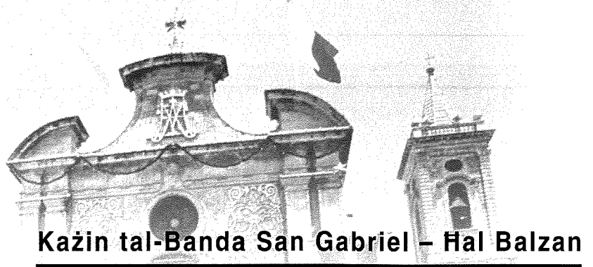
Kazin tal-Banda San Gabriel – Hal Balzan