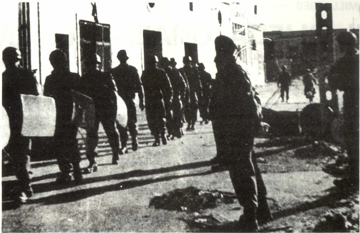
Nhar it-28 ta' April 1958, l-Ingliži ħarġu l-commandos biex isaħħu l-pulizija u l-kavallerija.

tiegħu. Mintoff keċċa lill-Kummissarju, iżda l-Gvernatur ma aċċettax u ħa l-pulizija f'idejha. F'dawn iċ-ċirkostanzi, il-Gvern Laburista iddikjara li ma setax jagħti garanzija taż-żamma ta' l-ordni fil-pajjiż u l-Gvernatur xolja l-Parlament u ddikjara stat ta' emerġenza.