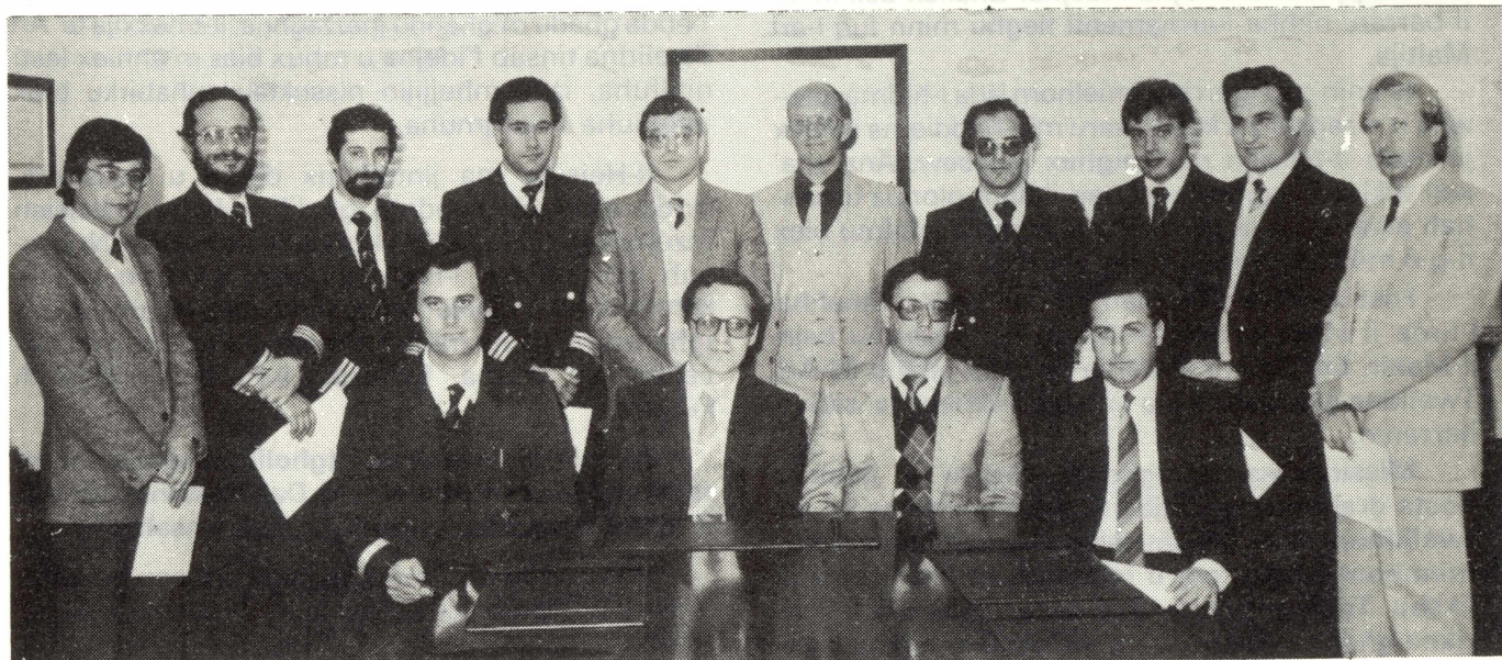
Il-haddiema tal-Linja Nazzjonali li temmew b'suċċess il-kors.