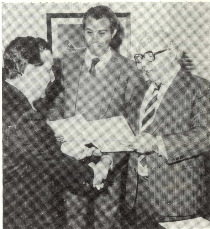
Id-Deputat Prim Ministru is-Sur Wistin Abela waqt il-prezentazzjoni taċ-ċertifikati.