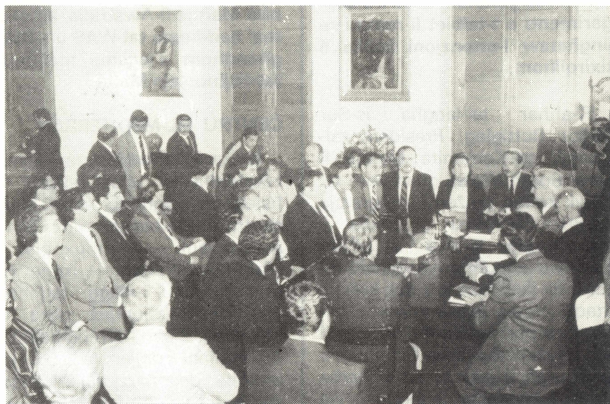
Il-Prim Ministru flimkien mar-rappreżentanti tal-Komunità Maltija waqt il-laqgħa f'Kastilja.

ftakru li bejnietna nistgħu ma niftehmu imma quddiem il-barrani huwa importanti li qatt u fl-ebda mument u bl-ebda mod ma tbaixxu x-xbieha ta' Malta. Importanti li tagħmlu dan speċjalment f'dawn iż-żmenijiet fejn mhux kulhadd jifhem li d-differenzi li għandna f'pajjiżna ma nkunu qed nagħmlu xejn ħlief inkabbruhom u mhux innaqqsuhom jekk inxerrduhom barra minn pajjiżna. Billi noqogħdu nxewxu lil ħutna barra minn pajjiżna biex jieħdu atteggjament favur jew kontra fuq kwistjonijiet lokali ma nkunux qed ngħinu lil Malta, ma nkunu bl-ebda mod qed nagħtu servizz lill-