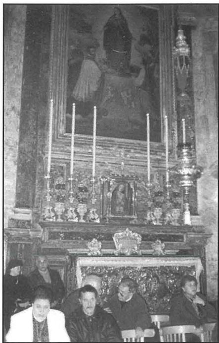
L-altar ta' San Gejtanu. Jidher ftit mill-bogħod il-ventaltar ukoll.

Wara xi żmien, fl-istess altar u kappellun, twaqqfet ukoll il-Kongregazzjoni tal-Qalb Safja ta' Marija. Ir-rappreżentanti ta' din l-Ghaqda, riedu huma wkoll li l-Madonna tkun inkluża f'dan il-kwadru u ghalhekk offrew minn buthom l-ispejjeż kollha biex isir dan. Ghalhekk, saret talba lill-Ghaqda ta' Sant'Agata