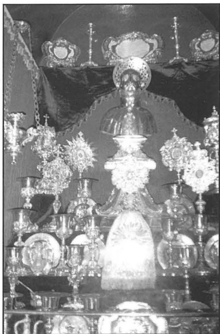
Il-bust tal-fidda ta' San Gejtanu għall-wiri ma' xi teżori oħra fl-okkażjoni tal-festa ta' San Pawl.

Peress li dan l-altar jaqa' direttament taħt il-Kollegġjata, fi żmien l- antik , qabel il-Konċilju Vatikan II, dan kien jintuża spiss għall- bżonnijiet ta' kuljum.