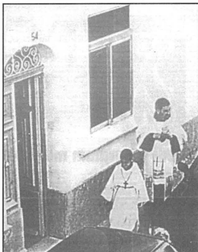
Il-Kappillan diehel ibierek dar f'Malta.

Wara li tkun tbierket id-dar u l-familja, normalment is-saċerdot kien