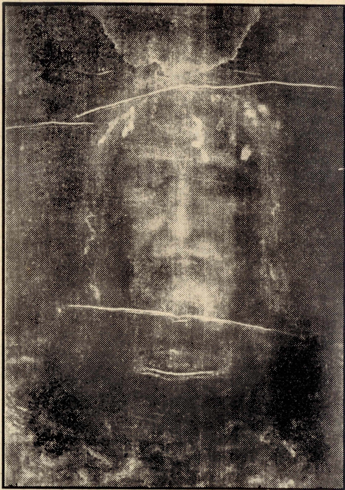
Il-Wiċċ Imqaddes ta' Sidna Ġesù Kristu; xbiha mehâda mil-Liżâr ta' Torîn.

ukoll għaqal, għerf, xohra u qdusija. It-tabib Hyner ta' Prâga, li dâm żmien twil jifli x-xbieha tal-Liżar, jghid li x-xbieha tal-ġisem tar-raġel il-mejjet, taqbel f'kollox ma' dak li jghidulu ġmiel klassku; ġmiel li jidher imfisser tajjeb fit-taqsim tal-għageb