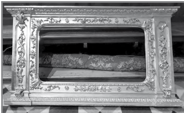
Il-ventartal tar-Rużarju qabel ir-restawr tal-2017

Huwa kurjuż il-fatt li minn dawn l-erbgha huwa biss tar-Rużarju li ma jissemmiex min kienu l-benefatturi jew jekk tħallas bil-kontribuzzjoni tal-poplu. Nistgħu nikkonkludu għalhekk li dan tħallas kollu mill-fondi tal-fratellanza li dak iż-żmien kienet għadha fl-aqwa tagħha.