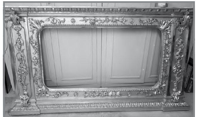
Il-ventartal tar-Rużarju waqt ir-restawr tal-2017