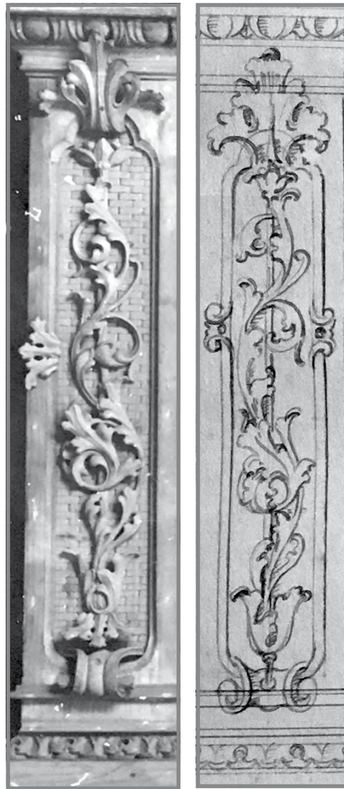
Varjazzjonijiet żgħir bejn id- disinn oriġinali u l-prodott finali

L-isbaħ mod kif niċcelebraw il-festa tal-PATRUNA TAGĦNA SANTA MARIJA hija billi nimlew il-knisja parrokkjali tar-raħal iddedikata LILHA fil-funzjonijiet li jsiru, speċjalment fil-granet tat-tridijiet, lejliet il-festa filgħaxija u għall-quddiesa tal-Panigierku nhar il-festa filgħodu. Għalhekk nuru mħabbatna lejn il-Madonna ommna billi NATTENDU BI HĠARNA.