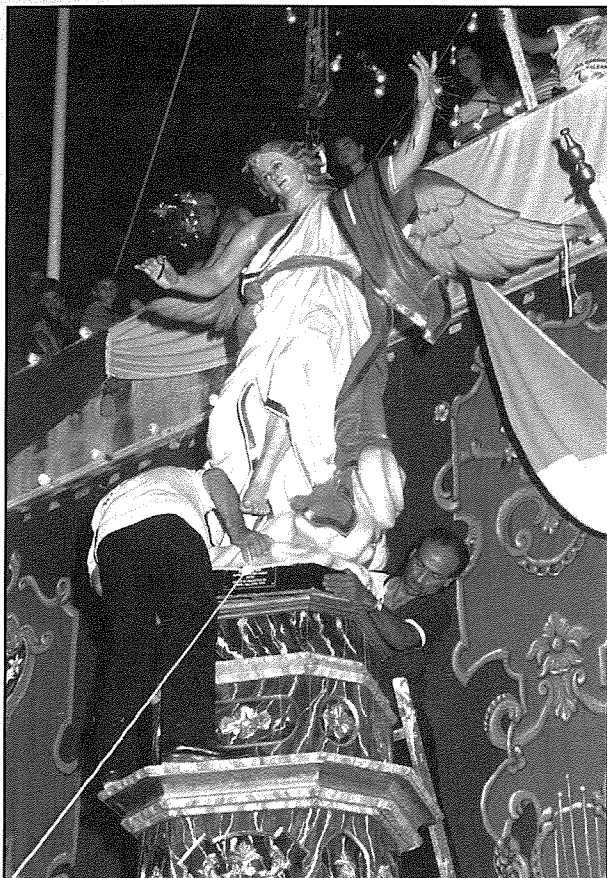
L-istatwa ta' San Gabriel tiġi mtellgħa permezz ta' grabja. Tidher titpoġġa fuq pedestall maestuz li jintrama biswit is-sede tas-Socjeta' - Festa 1993.