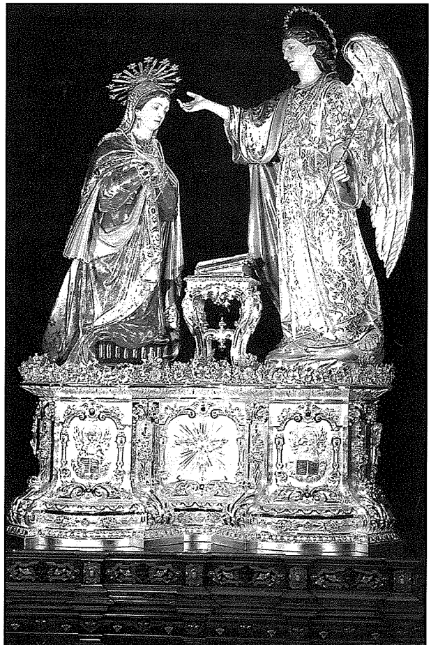
L-istatwa titulari ta' Marija Annunzjata, xogħol fl-injam ta' Mastru Salv Dimech. Din l-istatwa, l-għożża tal-Balzanin, issa ilha fostna 140 sena.

Mal-mogħdija tas-snin, meta fil-gzejjer tagħna bdiet diehla d-drawwa li l-parroċċa jkollha l-istatwa