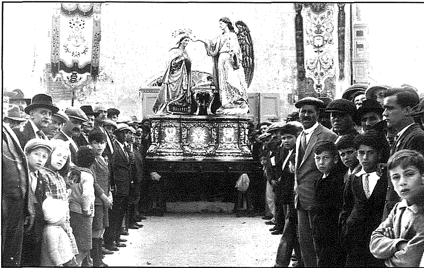
L-20 ta' April 1930. L-istatwa tal-Lunzjata, wara li sarulha xi tibdliet, giet indurata u zgraffjata mill-ġdid. Imdawra bid-devoti u d-dilettanti Balzanin fil-bidu tat-Triq il-Kbira, Hal Balzan, qabel ma ttehdet proċessjonalment lejn il-knisja parrokkjali.

allegoriċi ta' l-evanġelisti San Matthew u San Mark fuq kull naha. Fil-panewijiet tan-naha ta' wara n- Nome di Maria mdawra bi tna-x-il kewkba, flimkien ma' l-evanġelisti San Luqa u San Ġwann. Fil-ġnub tal-pedestall naraw il-profeta Isaija fuq naha u s-sultan David fuq in-naha l-oħra. Il-brazzi tal-fidda li kienu jintramaw mal-pedestall fil-festa tnehhew ukoll. 40