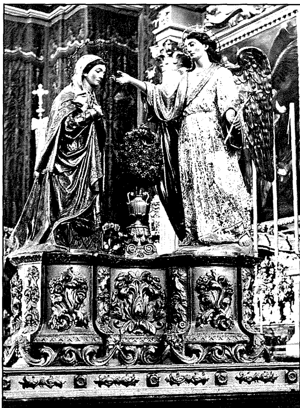
L-istatwa tal-Lunzjata, fl-istat originali tagħha, armata għall-festa fil-kappellun tar-Rużarju. Ritratt ta' l-ewwel kwart tas-seklu 20.