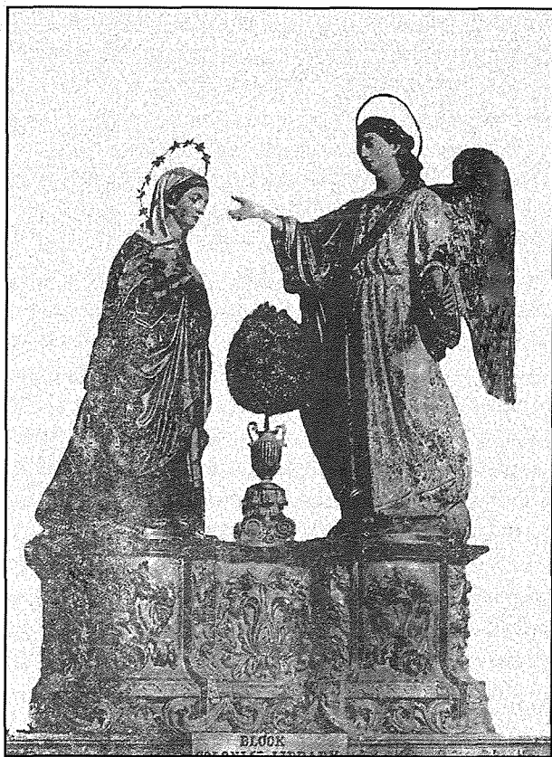
L-istatwa tal-Lunzjata kif harġet minn idejn l-iskultur Salvatore Dimech fl-1868.

xi spejjeż ohra li setghu jinqalgħu, iżda ma kinitx tinkludi la l-induratura u lanqas il-pedestall. Muscat u Borg kienu t-tnejn responsabbli ndaqs b'għidhom fl-obbligazzjonijiet tal-hlas imwiegħed. Is-somma dovuta kellha tithallas hekk kif l-istatwa bla difetti tingħatalhom lesta għall-induratura. L-ispejjeż tat-trasport kienu għall-klijenti.