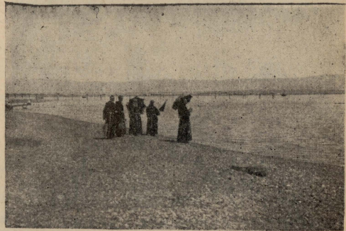
Il-Baħar il-Mejjet. La hût u la beb-bûa ma jinsab gewwa fih, anqas sigar jew hawia ma' dwaru...

Ilbist u tlaqt mat-trejqa, fix-xtajta tal-Għarb ta' dak il-baħar. L-ewwel ma lhaqt kien Wadi n-Nâr, li minnu fix-xitwa jghaddi l-ilma tal-wied ta' Cedron, u jiferragh fil-baħar Mejjiet. Bqajt sejjer u rajt Ghajn Gidi, qrib il-belt qadima ta' Engaddi, imsem-