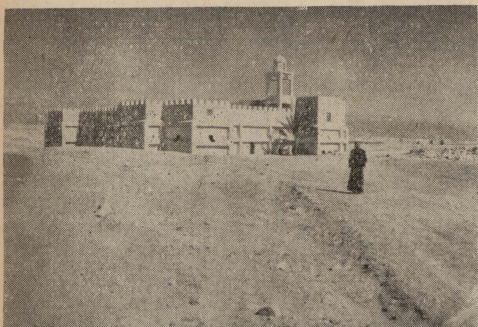
Id-Dejr ta' San Gwann il-Għammiedi, tal-Griegi Ortodossi msemmi f'dil-kitba, li jnsab hdejn il-Gurdan.

Geriku — il-belt hienja, li għal sebat ijiem laqgħet fi hđanha l-Arka tal-Liġi l-Qadima, u f'hin wiehed imsejkna, għax kemm il-darba l-għlied u l-gwerer garrfuha — dahlitli hekk f'qalbi, li ma nistax ninsieha! Hassejtni nitnikket meta htiegħli nitbiegħed minnha. Imma hallejtha lil Geriku l-għażiża, u ġbidt bil-qajla għannaha ta' Wadi l-Qelt sa ma wasalt fir-rahal ta' Gālgala, xi żewġ mili bghid minn Geriku. Gālgala tista' tghid kienet l-ewwel maqdes tal-Art Imqaddsa, għax hemmhekk l-Arka tal-Għaqda l-Qadima damet għal sitt snin shāh. Hemmhekk ukoll, il-Gens Lhudi għamel l-ewwel Għid il-Kbir tiegħu, wara li dahal fl-Art Imwegħda.