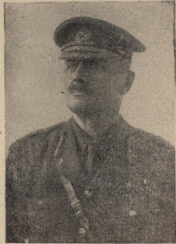
Il-Ġeneral Sir Edmund Allenby, G.C.M.G., K.C.B., li heles lil Ġerusalem mill-madmad tat-Torok, fl-1917 (Twieled fit-23 t'April 1861 u miet fl-14 ta' Mejju 1936.

fid-dellijiet tal-Wied ta' Gosafat, sejr in lejn Gerku u l-Gordan, in-nies ta' Ġerusalem qamu mit-telqa li l-guġħ u l-Pulizija Torka kienet tefghathom fiha. Xtehtu fuq għadd ta' djar li qabel kienu tal-fizzjali jew tas-suldati, u hadu kull ma kien hemm fihom, saħansitra l-bibien u z-zingu tal-osqfa tal-barrakki, li kienu hada Bieb il-Halil, jew it-Torri ta' David. Jaqbel wiehed jghid li n-nies kellhom għal fejn jagħmlu hekk, għax kull ma kelliha l-Hakma Torka, kien magħmul bis-saħħa tal-poplu, li ma kienx imħallas tiegħu; għal hekk in-nies ma kienux jagħmlu haġa oħra għajr jieħdu ffit mill-hafna li kien jisthoqqilhom. Imma dad-dizordni għab f'daqqa, bhal ma f'daqqa kien beda, malli daħlu l-ewwel suldati Inġliżi fil-belt. Is-serq kien magħmul minn gemgħat zghar ta' nies, bil-hatfa u bil-mistur.