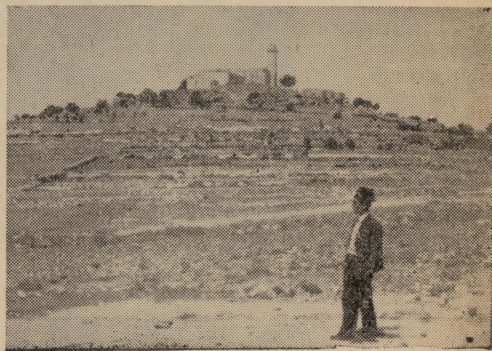
Il-ġholja tan-Nebi Samwil, li fuqha sar taqbid kbir bejn l-Ingliżi u t-Torok, u ntrebħet u ntilfet min-naħa l-waħda u l-oħra xi hames darbiet. Tidher il-moskija, mibnija mill-ġdid, f'tit ilu.

Għal din l-aħbar għall-ġharrieda biża' kbir waqa' fuq it-Torok, u fil-5 ta' fil-ġhaxija in-nies lemħu kolonna sħiħa tat-trasport Torka issuq b'kemm kellhom saħħa mat-triq ta' Gaffa lejn Ġerusalem. Hi u miexja qajjmet lil ġemgħat tas-suldati kollha, li rawha