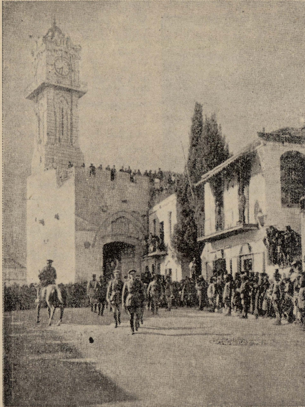
Il-General Allenby diehel Ġerusalem bil-mixi, minn Bieb il-Ḥalil, fis-sebġha u nofs tal-ġhodwa tal-II ta' Diċembru 1917.

għandhom jibqgħu ġewwa fid-djar, u jgħinu lit-Torok fit-taqbid li jsir minn dar għal dar. U min ma jaġhmex hekk, kien ikun imħallas hażin għall-aħħar. It-tieni xandira kienet tgħid li t-Torok kienu żammew lil Ġerusalem