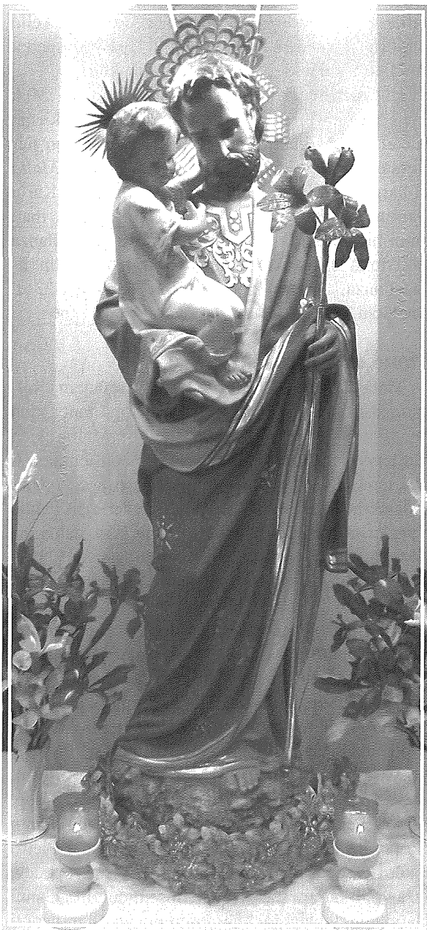
L-istatwa ta' San Ġuzepp.