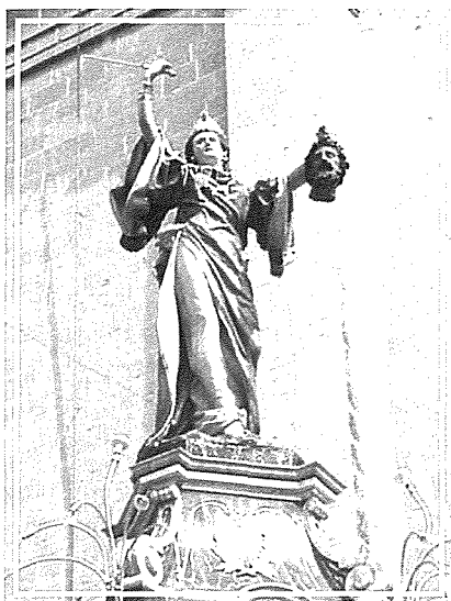
Giuditta u Oloferne