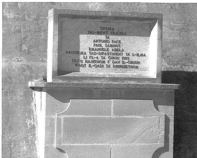
L-irhama ta' tifikira tal-vittmi tat-traġedja.

Ittiehded id-deċiżjoni li jippruvaw jidhlu għall-ħaddiema mill-ġenb tal-ġibjun billi jifthu toqba fil-ġenb oħxon tal-ġibjun li kien tal-konkos. Għalhekk intużaw l-isplussivi. Hekk kif bdew l-isplussivi, bosta djar tal-irhula viċin il-ġibjun, inkisrilhom il-ħgieg tat-twieqi. Niftakar qalulna biex nifthu it-twieqi tal-gallarijiet biex il- blast ma jkomplix ikisser il-ħgieg tat-twieqi, għax ix-xogħol u l-isplużjonijiet kellhom jibqgħu sejrini tul il-lejl kollu u anke l-għada s-Sibt.