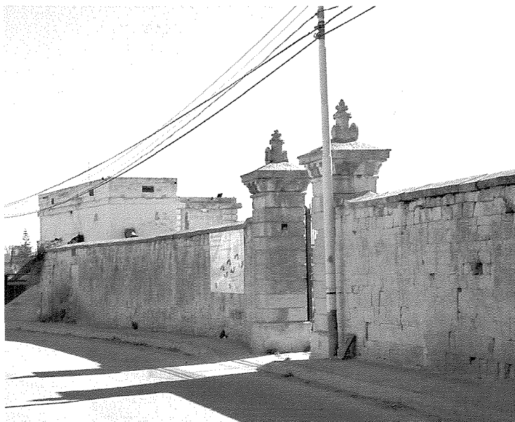
Il-parti l-antika tal-ġibjun.

F'hin minnhom il-ħajt diviżorju tal-blat ma felaħx il-pessjoni tal-ilma, infaqa' u parti mis-saqaf tal-konkos tal-ġibjun ċeda għal isfel fejn kien hemm l-erba' haddiema. Wieħed mill-haddiema li nzerta