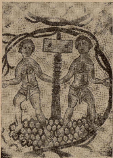
Gerax. — Biċċa mill-mużajk tal-art tal-knisja li kixfu l-Fraŋgiskani. Jidhru żewġ itfal għedin jaghsru l-gheneb.

Mill-hajja u x-xoghol tal-insara ta' Gerax, l-aktar haġa li għadha tidher sal-lum, huma l-fdalijiet tal-knejjes li bnewhom ma' tul tlett mitt sena. Fit-taħfir li sar f'dil-belt xi għaxar snin ilu, inkixfu fdalijiet ta' tnaaxer knisja (dra-