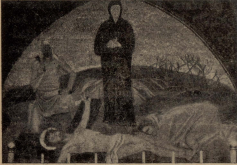
Gerusalem. — L-inkwatra tal-mużajk fi-artal tat-Tislib, fuq il-Kalvarju.

Mill-blata Mqaddsa tal-Kalvarju, li fuqha l-Lhud u r-Rumani sallbu lil Gesù u liż-żewġ hallelin, il-lum ma fadalx għajr kagħhab, jew kubu tal-blat ta' xi hmistaxer xiber għoli, tul u wisa'. Fu-