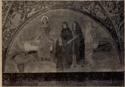
Ġerusaleml. — In-nisa tal-Galilija, shab il-Madonna. Inkwatru tal-mużajk fil-hajt tal-kappella fuq il-Kalvarju.

imkienha xbieha bħalha sewwa tal-mużajk. Ix-xbieha fiha: Ġesù mimdud fuq is-salib, u sallab isammarlu idu x-xellugija; il-Madonna bil-wieqfa thares, u l-Madaliena għarkubtejha f'rignejn Ġesù. Fil-hajt tal-ġenb, qrib l-artal, xbieha oħra tal-mużajk ukoll tu-