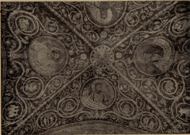
Gerusalem. — Is-saqaf tal-kappella tal-Kalvarju. Xbieha tal-mużajk tal-erba' Profeti bil-kliem tagħhom miktub f'idejhom.

Imma għoxrin sena ilu, jiġifieri fis-sena 1938, il-Frangiskani, wara ħafna talb u thannin, qalgħu li jerggħu jiksu bil-mużajk il-hitana u s-saqaf tal-kap-