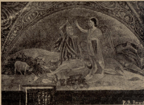
Ġerusaleml. — L-Anglu jzomm id Abraham biex ma jidbaxx lil ibnu Iżhak. Inkwatru tal-mużajk fil-kappella tal-Kalvarju.

ri n-nisa tal-Galilija li kienu telġu Ġerusaleml ma' Ġesù. U aktar 'il barra, xbieha ta' Abraham sa joqtol lil ibnu Iżhak u l-Anglu jzommlu s-sikkina. Id-disinn ta' dal-mużajk għamlu l-pittur Taljan Luigi Trifoglio, u hadmuh