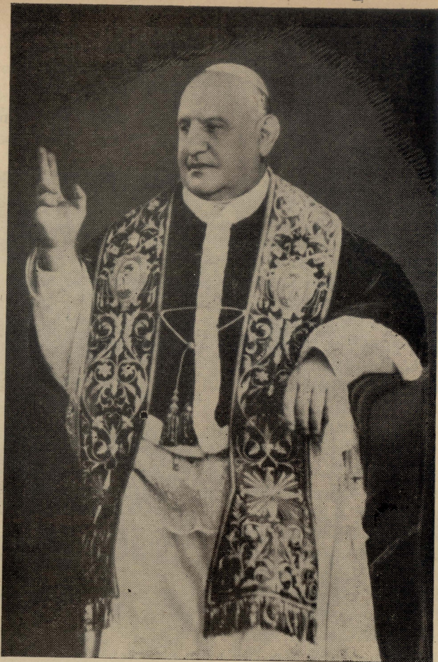
Il-Qdusija Tieghu l-Papa Ġwanni XXIII, ftit jiem wara li nhatar.

(Ritratt misluf lilna mill-“Information Office”)