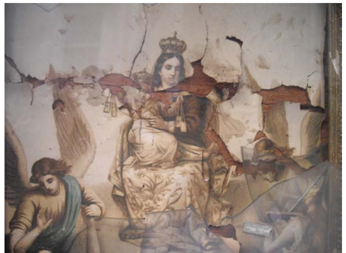
Parti mill-kwadru bix-xbieħa tal-Madonna