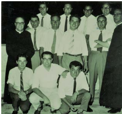
Hbieb tal-A.K. flimkien mal-qassisin Corrado u Manchè

L-Innu 'l-Madonna tal-Ġebbla: Fl-artiklu tiegħu 'Innu ta' Naxxari ġdid Mużikat', datat it-12 ta' Lulju 1951, insiru nafu li Dun Anton għamel użu mill-vers tal-għaxra (dekasillabu) minħabba l-mużika. Fil-każ tar-ritornell imbagħad, il-poeta haddem il-vers tat-tmienja (ottonarju) li spiss niltaqgħu miegħu fil-kwartini tal-għana popolari. Dun Anton ma naqasx li fl-artiklu jikkwota r-ritornell peress li l-qofol tal-grajja kollha jinsab f'dawn l-erbat ivrus: Jekk barrani kasbar ġieħek;/ Meta ġebbla tefa' għalik; / Ahna biss vleġeġ ta' mħabba, / Għandna jtiru għal ġo fik.