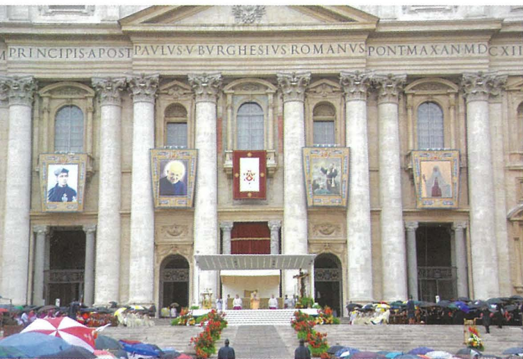
Pjazza San Pietru fl-ghodwa kollha xita tal-Hadd, it-3 ta' Ġunju 2007. Il-Papa Benedittu XVI jikkanonizza erba' beati, fosthom San Ġorġ Preca, il-Fundatur tas-Socjetà tad-Duttrina Nisranija (MUSEUM), l-ewwel qaddis kanonizzat Malti. Madwar hamest elef Malti u Għawdxi kienu preżenti Ruma għal din l-okkażjoni

Fil-ktieb tiegħu li jġib l-isem Il-Ktieb tas-Sinjali , Dun Ġorġ jagħti sensiela ta' 43 sinjali ta' min hu tassew devot ta' Marija. Fost dawn is-sinjali jispikkaw dawk marbutin mas-sehem ta' Marija fil-misteru ta' Kristu. Hekk, il-veru devot ta' Marija "jifirhilha bil-qalb għall-kbira u unika grazzja li sabet quddiem Alla, jara fiha b'mod speċjali t-Tjubija u s-Sapjenza ta' Alla li għażilha b'Omm is-Salvatur tagħna, ibierek il-ġuf verginali tagħha li ġieb lill-Iben ta' Alla magħmul bniedem, u s-sider li reddgħu." 33 Sinjali oħra ta' qima vera lejn Marija f'min "jieħu gost u jitpaxxa jisma' fuqha, jaħdem biex ixerred id-devozzjoni lejha, jagħtiha qima, u jzommha bħalma iben iżomm lil ommu." 34 Iżid ukoll li d-devot veru ta' Marija ma jabbużax mit-tjubija tagħha, iżda jimitaha fl-umiltà u fil-karità tagħha, u jqimha bir-Rużarju li hu tant għal qalbha. 35