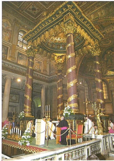
Is-Sibt, it-2 ta' Ġunju 2007. L-artal maġġur tal-Bażilika ta' Santa Maria Maggiore waqt il-Velja ta' Talb bi thejjija għall-kanonizzazzjoni tal-Beatu Ġorġ Preca.

Jiddomina fuq il-presbiterju tal-Bażilika l-ark absidali tal-mużajk li jfakkar il-Konċilju ta' Efesu, li fis-sena 431 iddikjara 'l Marija bħala Omm Alla, Theotokos . Il-filliera ta' fuqnett ta' dan l-ark absidali turi l-episodju tat-Thabbira ta' l-Arkanġlu Gabriel lil Marija. Nistqarr li dak il-hin hassejtni ferhan ukoll li twelidt u tgħammidt u għadni ngħix sal-lum fil-Parroċċa ta' Hal Balzan, iddedikata lill-Annunzjata. Dak il-hin ma stajtx ma ngibx quddiem għajnejja r-rabta ta' Dun Ġorġ mal-Madonna, l-aktar fl-episodju tat-thabbira tagħha, u kif huwa jgħaqqad din il-ġrajja mal-ġieħ kbir li ngħatat Marija bħala Omm Alla.