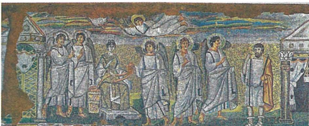
Ix-xena tat-Thabbira ta’ l-Arkanġlu Gabriel lil Marija li fiha jidher ukoll San Ġużepp. Parti mill-ark absidali tal-mużajk fil-Bażilika ta’ Santa Maria Maggiore.