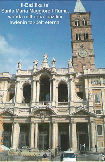
Il-Bażilika ta' Santa Maria Maggiore f'Ruma, waħda mill-erba' bażilici ewlenin tal-belt eterna.