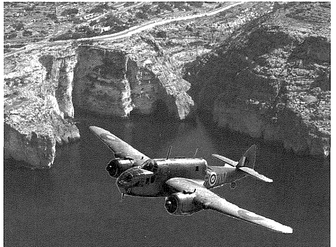
Ritratt fuq in-naħa tal-lemin: juri rikostruzzjoni tal-ajruplan Bristol Beaufort quddiem il-hnejja tal-Blue Grotto

Dawn iż-żewġ Qrendin flimkien ma' dak Żurrieqi involuti f'dan is-salvataġġ tal-piloti Inglizi, ngħataw